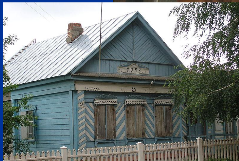
Первый дом, перевезённый из Ставрополя при переносе города