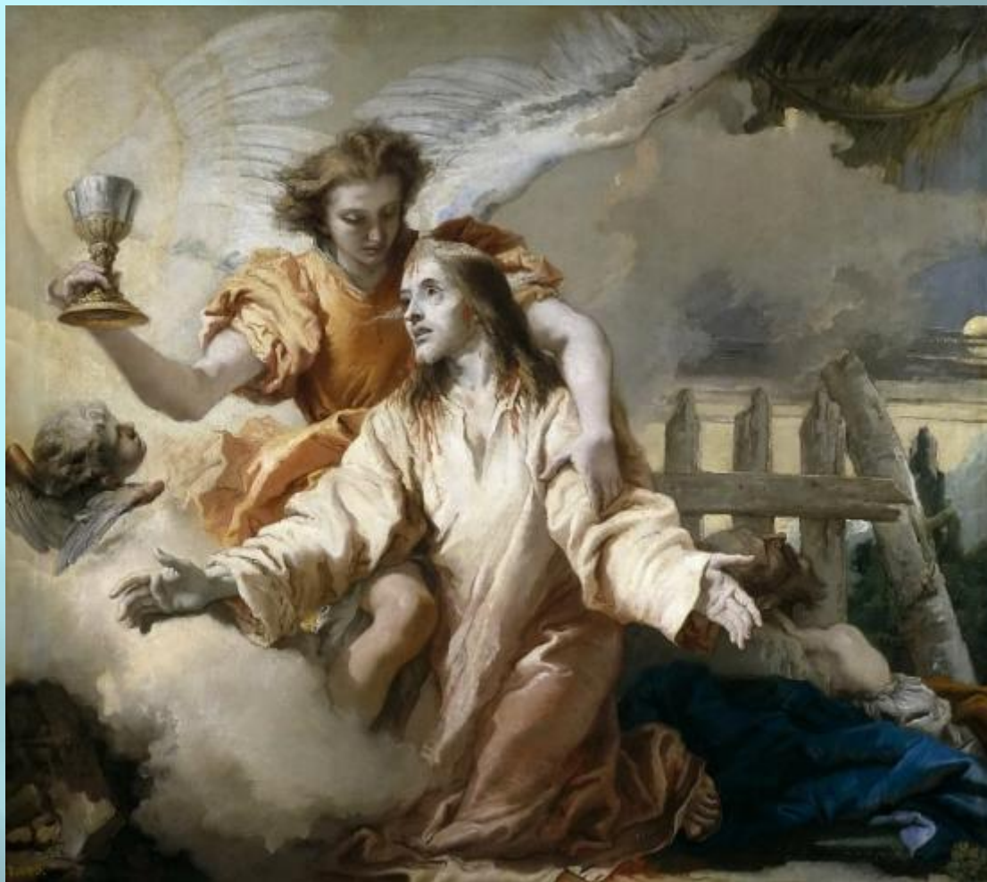
Джованни Доменико Тьеполо. Моление о чаше. Прадо.

В этом мире с каждым из нас происходят события, которые мы не в состоянии осмыслить, вот тогда в полной мере испытывается вера человека, и в такой момент человек может быть укреплен тем, что Христос тоже прошел через это в Гефсиманском саду. А это значит, что каждый человек в нужный момент должен научиться сказать: «Да будет воля Твоя».