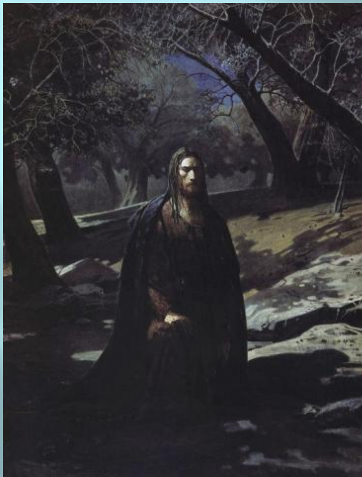
Н.Н. Ге. Христос в Гефсиманском саду. 1869 год.