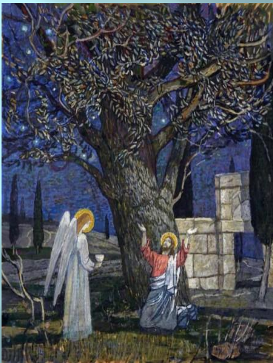
Петров – Кириллов Владимир. Моление о чаше

В окнах базилики - затемненные стекла, мозаики изображают события, произошедшие в Гефсиманском саду, а на бронзовой двери церкви вычеканено Древо Жизни, произрастающее из креста – орудия убийства, превратившегося в знак победы и воскресения. Есть в этой сравнительно новой церкви фрагменты древних мозаичных изображений, обнаруженных на этом месте.