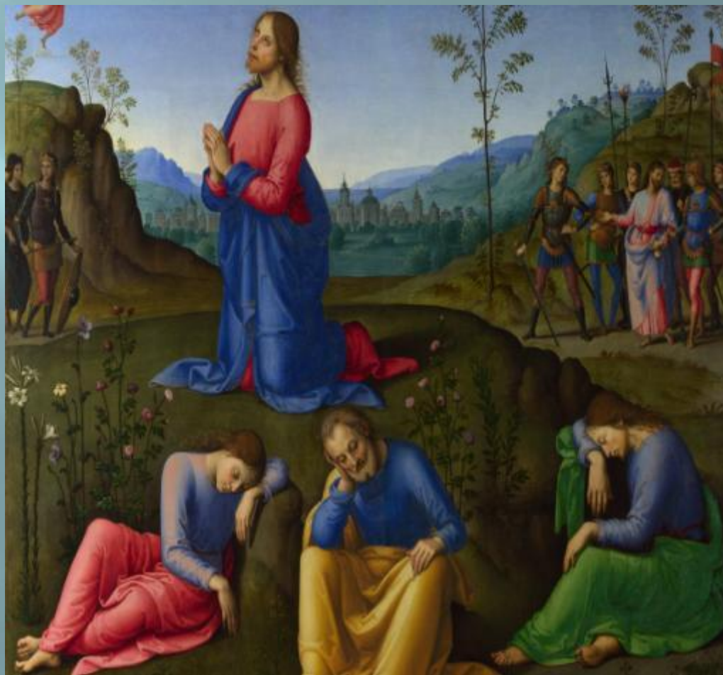
Lo Испании, Моление о чаше, Lo Spagna