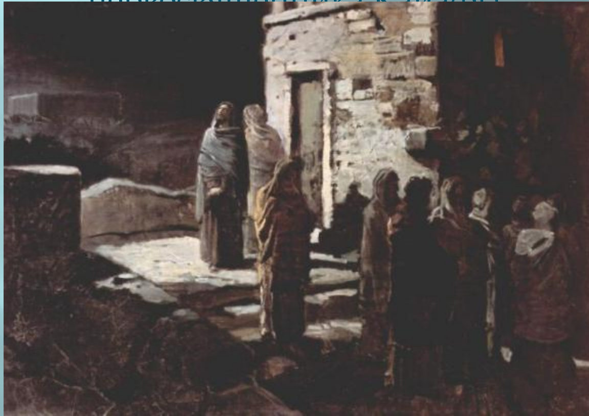
Н.Н. Ге. Выход Христа с учениками с Тайной вечери в Гефсиманский сад.

В ночь с четверга на пятницу Иисус с одиннадцатью учениками вышел в Гефсиманский сад, находившийся у подножия Елеонской горы. А в это время Иуда уже торопился к дому первосвященника Каиафы.