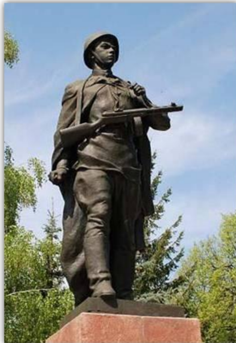
Памятник А. Матросову в городе Уфе