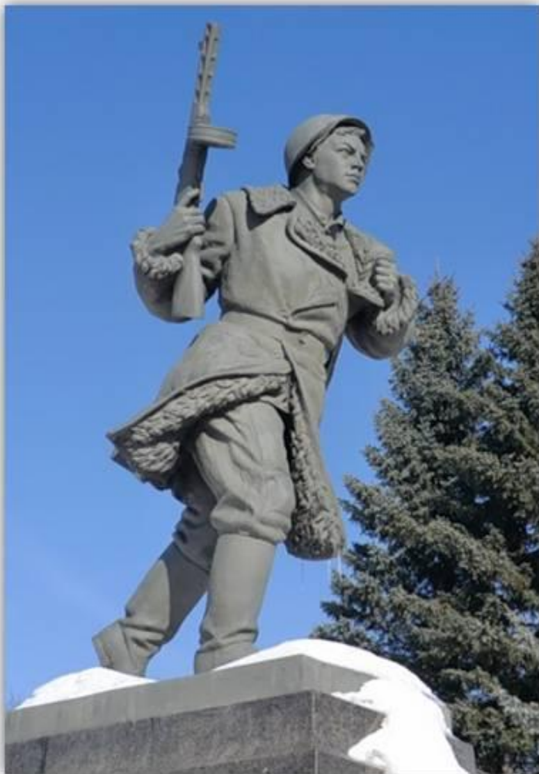
Памятник А. Матросову в городе Великие Луки