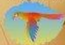
Стрельба по попуазам