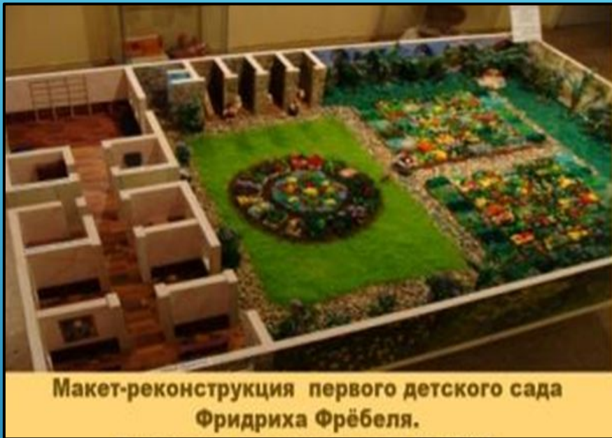
Макет-реконструкция первого детского сада Фридриха Фрёбеля.

Детские сады Фребеля создавались не взамен семьи, а в помощь матерям в воспитании и развитии детей. Матери могли прийти и посмотреть, как заниматься с детишками, поучиться у воспитательниц.