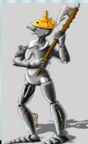
Железные й дровосек