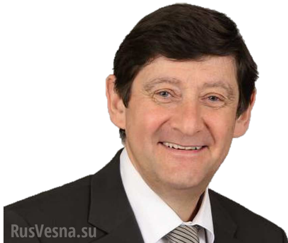
Господин Патрик КАННЭР , по делам молодежи, спорта и общественных организаций