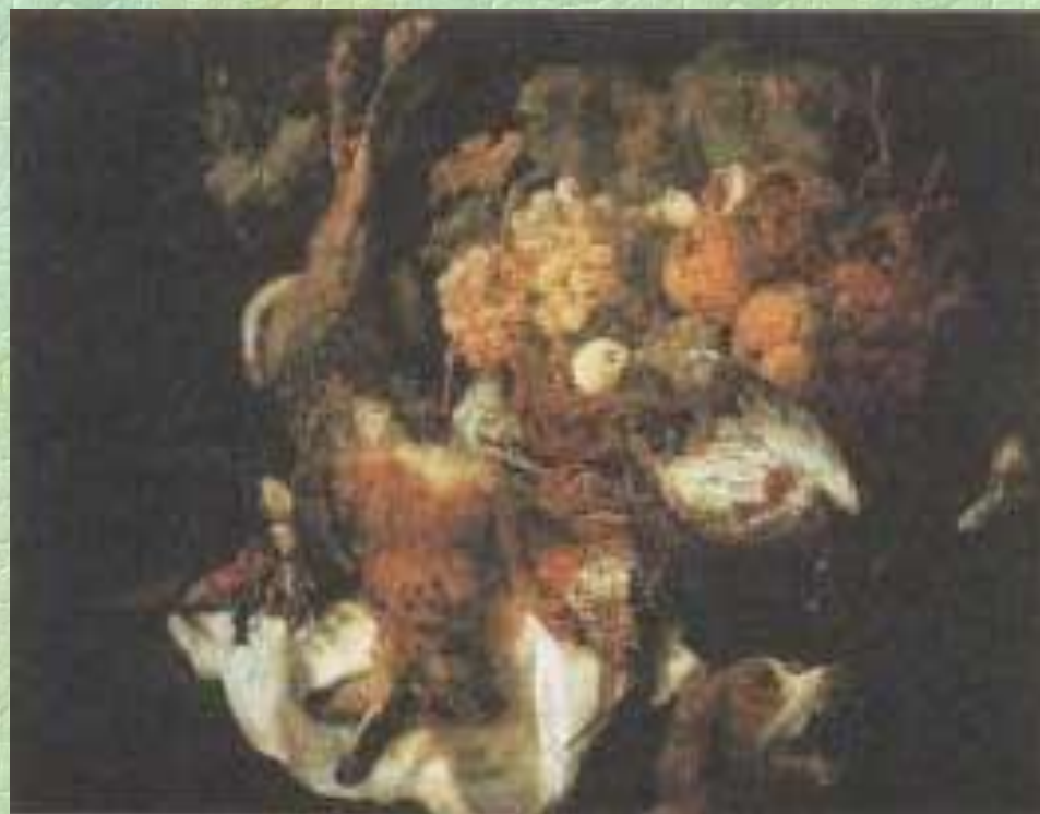
Ян Фейт. Натюрморт с собакой.

Манера фламандского художника Яна Фейта более изысканна, чем у его учителя Снейдерса. Подчёркнуто скромные по композиции и размерам произведения Фейта интересны гармонией сдержанного света, тонких оттенков коричневых, зеленоватых и светло-серых тонов. Это несравненная чуткость живописца сближает его с голландскими мастерами.