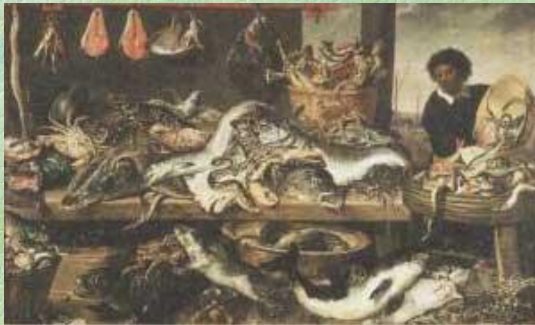
Франс Снейдерс. Фламандская школа. Рыбная лавка.

Его расцвет начался в Голландии, где Реформация, запретив художникам писать картины на религиозные темы, вынудила их искать новые направления.