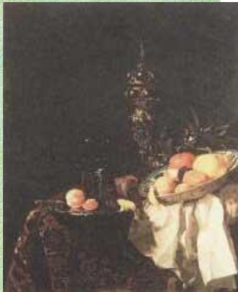
Виллем Калф. Десерт. Ок.1659г.

На картинах Абрахама ван Бейерна и Виллема Калфа изображены грандиозные пирамиды из дорогой посуды и экзотических фруктов.