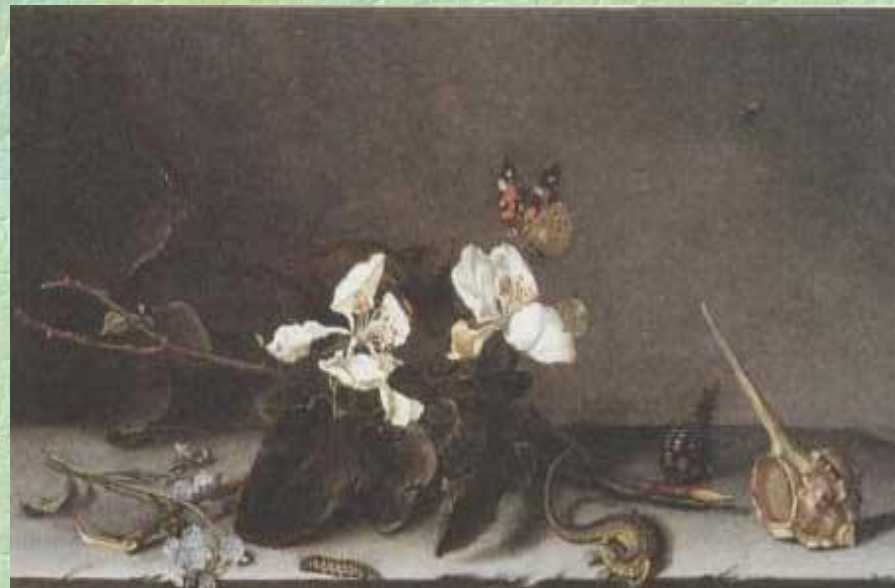
Балтазар ван дер Аст.

В натюрмортах, относящихся к началу XVII столетия, предметы расставлены в строгом порядке, словно экспонаты в музейной витрине. В подобных картинах детали наделяны символическим значением. Яблоки напоминают о грехопадении Адама, а вино град — об искупительной жертве Христа. Раковина — оболочка, оставленная, когда то жившим в ней существом, увядшие цветы — символ смерти. Бабочка, родившаяся из кокона, означает воскресение. Таковы, например, полотна Балтазара ван дер Аста.