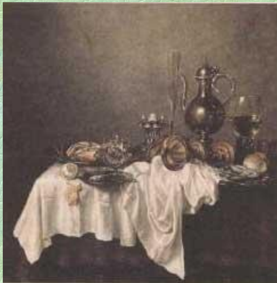
Виллем Клас Хедда. Завтрак с крабом.

В натюрмортах его земляка Виллема Класа Хеды царит живописный беспорядок. Чаше всего он писал «прерванные завтраки». Смятая скатерть, перепутанные предметы сервировки, еда, к которой едва притронулись, — всё здесь напоминает о недавнем присутствии человека. Картины оживлены многообразными световыми пятнами и разноцветными тенями на стекле, металле, полотне.