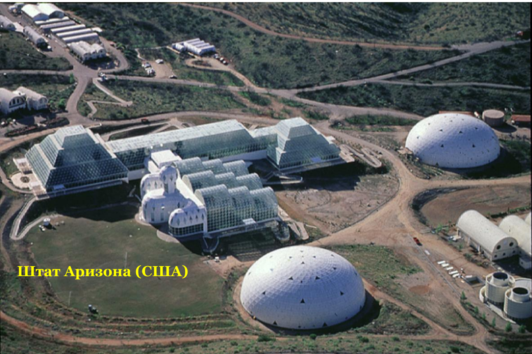
Штат Аризона (США)