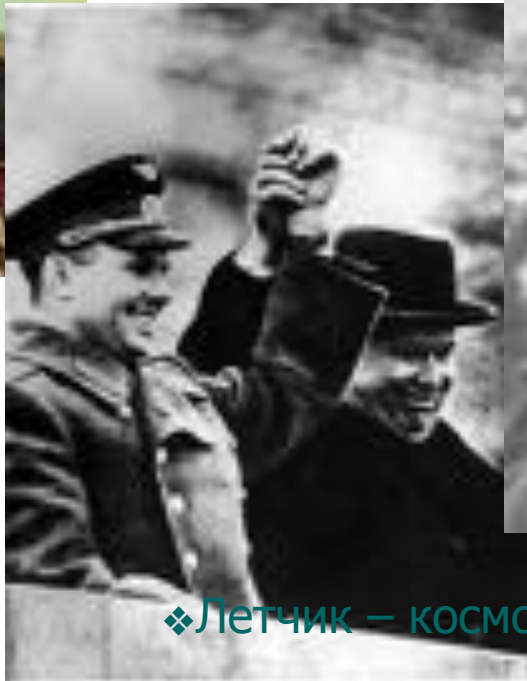
❖ Летчик – космонавт СССР Ю.А.Гагарин