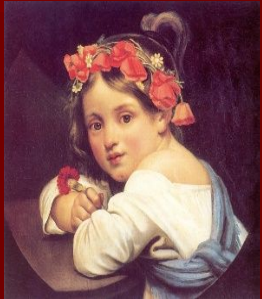
Портрет работы Крамского.