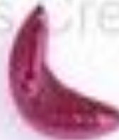
изогнутый полукруг (месяц, полумесяц)