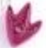
утиная лапка (плечья лапка)