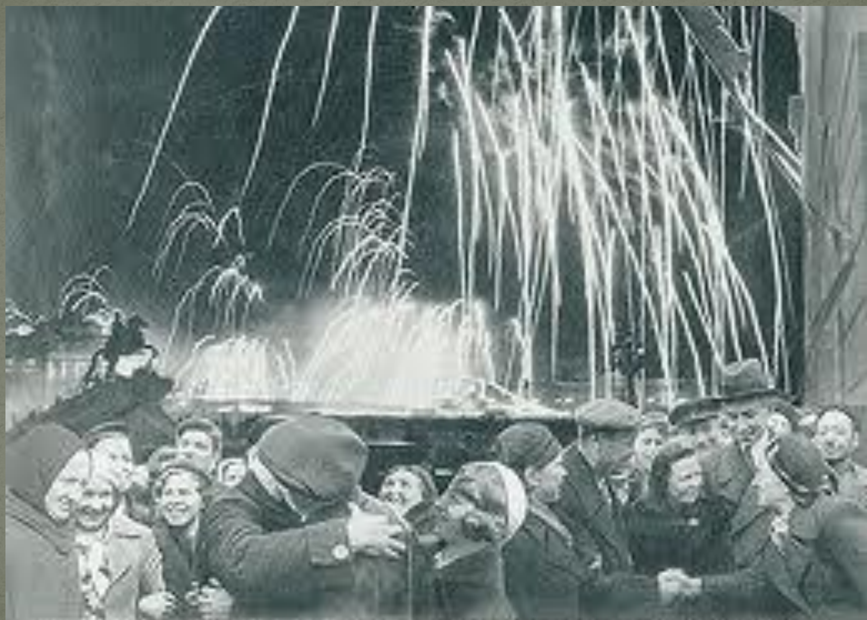
Великая победа одержана советскими войсками под Ленинградом!