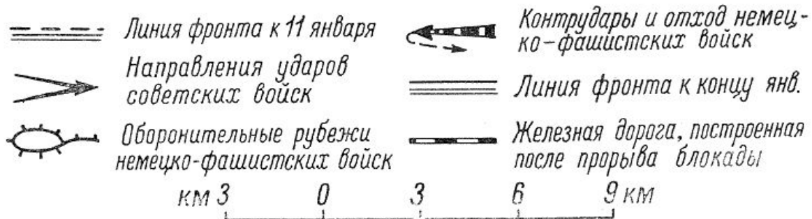
Прорыв блокады Ленинграда. Январь 1943 г. Схема.