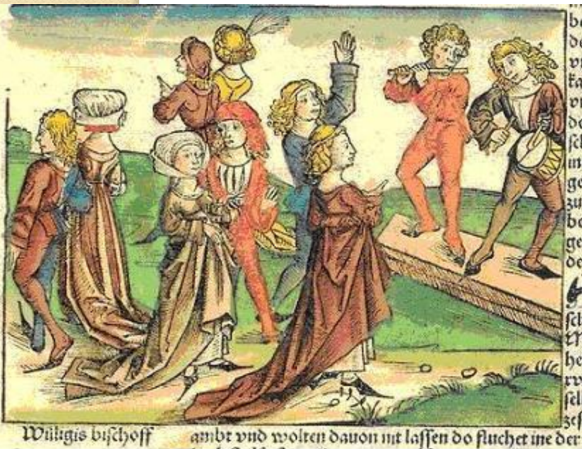
Иллюстрация из книги. 1494 г.

Средневековый танец оставался еще во многом импровизированным действием. Народ любил хороводы, но устойчивых правил танца не существовало. Танец был принятой формой ухаживания; их исполнители сопровождали танец пением; движения были самыми простыми. В XII в. культ романтической любви и рыцарства в значительной мере преобразил танец, приглушив его откровенно эротические черты. Танец входил в число обычных для рыцаря занятий и выступал как своего рода домашняя параллель к турнирам на открытом воздухе. Обычно танец возглавляла одна пара, к ней присоединялись другие, медленно двигаясь по кругу; тип этого танца во многом напоминал полонез.