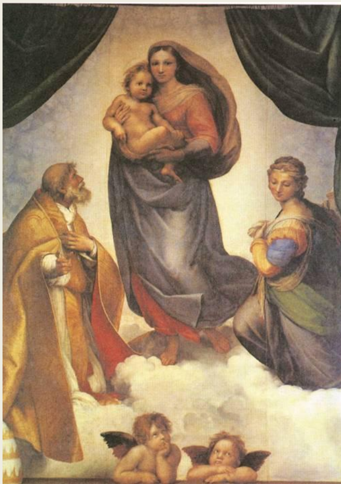
РАФАЭЛЬ. Сикстинская мадонна

Художники разных эпох использовали симметричное построение картины. Симметричными были многие древние мозаики. Живописцы эпохи Возрождения часто строили свои композиции по законам симметрии. Такое построение позволяет достигнуть впечатления покоя, величественности, особой торжественности и значимости событий.