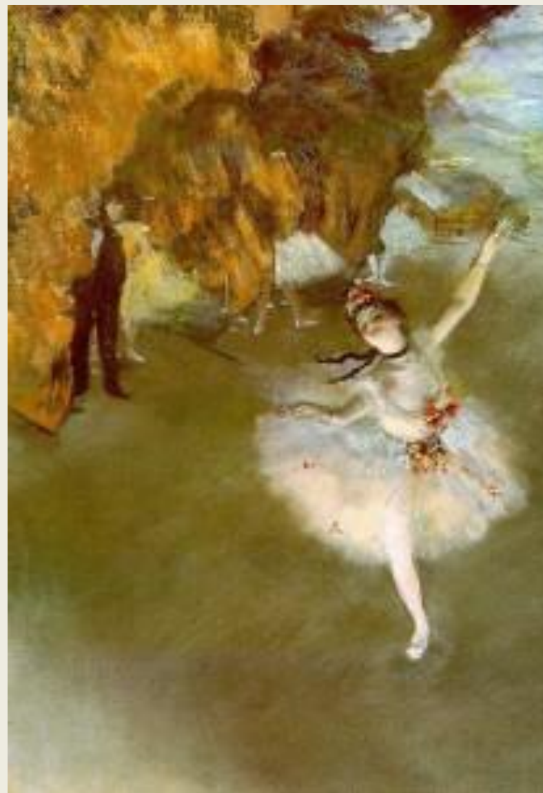
Э.Дега «Прима – балерина»

В отличие от симметричной композиции, в асимметричной композиции необходимо достичь зрительного равновесия. Асимметричная композиция более гибка по сравнению с симметричной, она дает возможность неповторимого сочетания элементов и поэтому всегда индивидуальна .