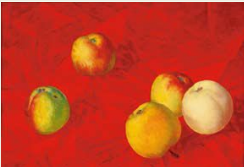
К. Петров-Водкин. Яблоки