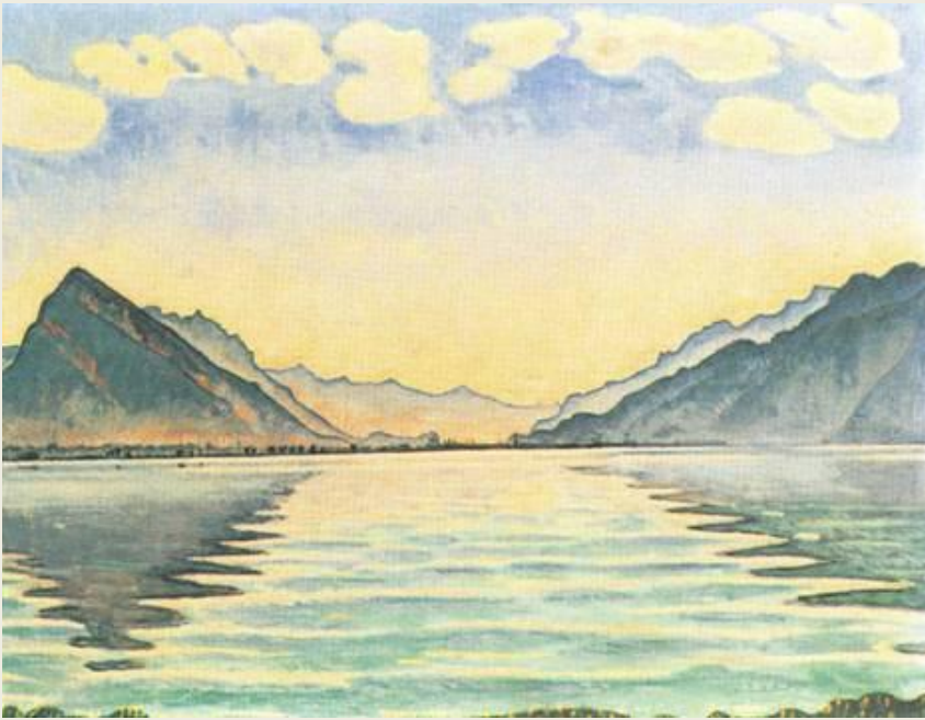
Ф. ХОДЛЕР. Озеро Тан

В симметричной композиции люди или предметы расположены почти зеркально по отношению к центральной оси картины.