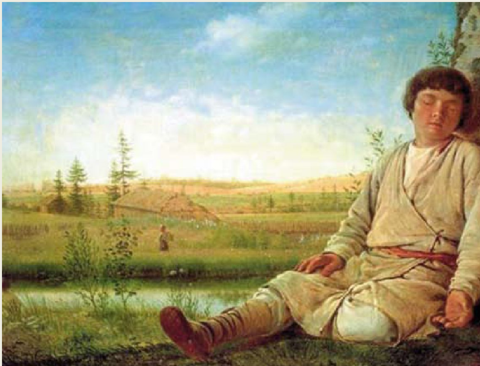
А. Венецианов. Спящий пастушок