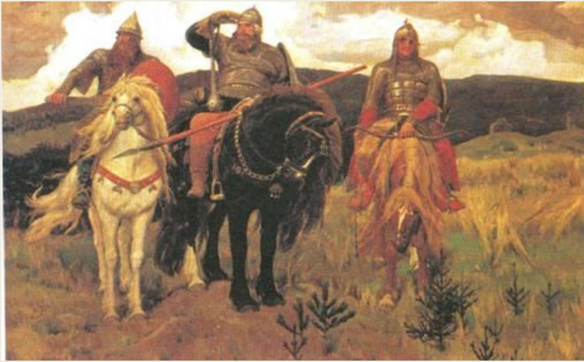
В. ВАСНЕЦОВ. Богатыри

Симметрия в искусстве основана на реальной действительности, изобилующей симметрично устроенными формами. Например, симметрично устроены фигура человека, бабочка, снежинка и многое другое.