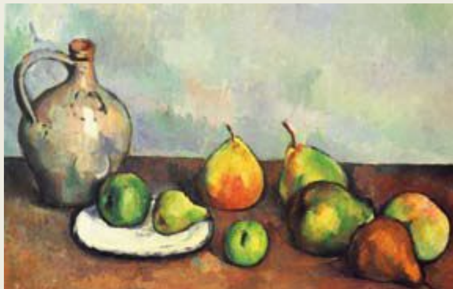
П. Сезанн. Натюрморт с белым кувшином