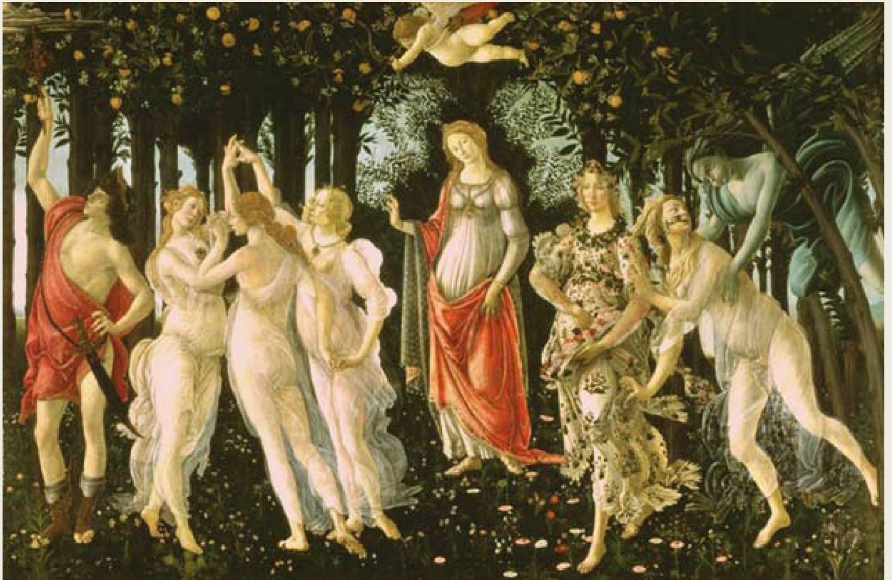
С. Боттичелли. Весна