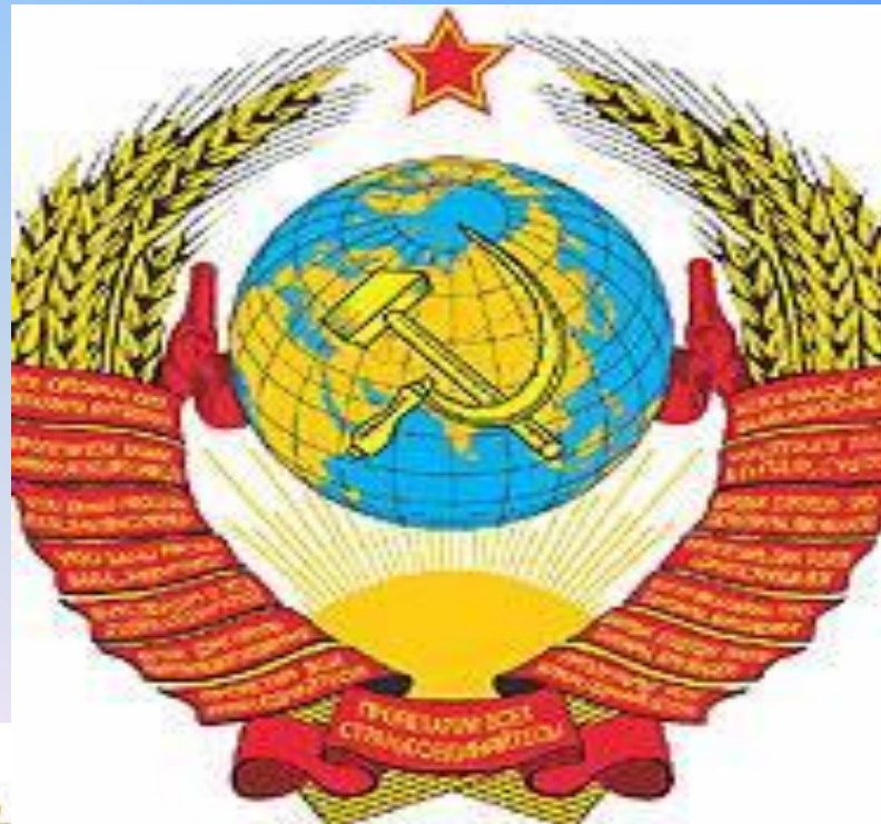
Герб СССР в 1980