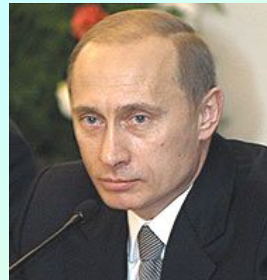
ПУТИН Владимир Владимирович

Впервые новый гимн прозвучал 1 января 2001. В марте 2001 текст утвержден Государственной Думой