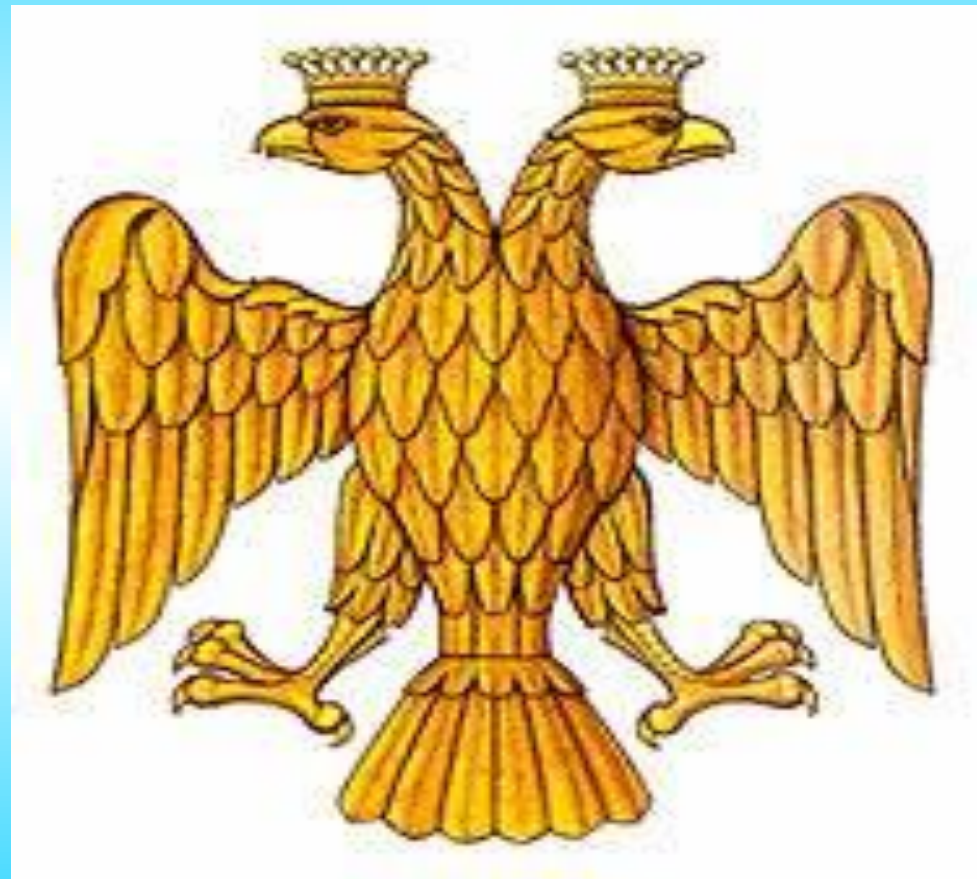
Герб Московского царства при Иване III