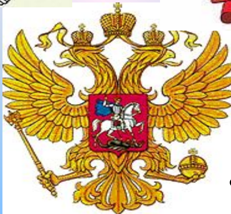
Герб Российской Федерации в 1993