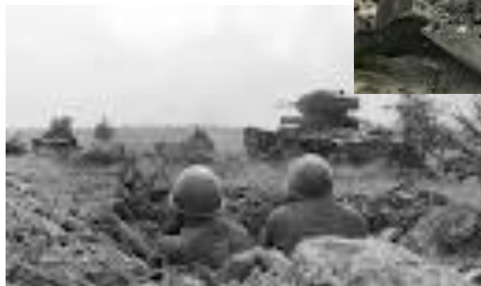
Ельня, октябрь 41г.