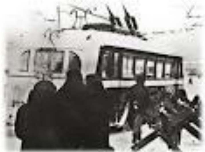
Глядя Москвы в дни осады города