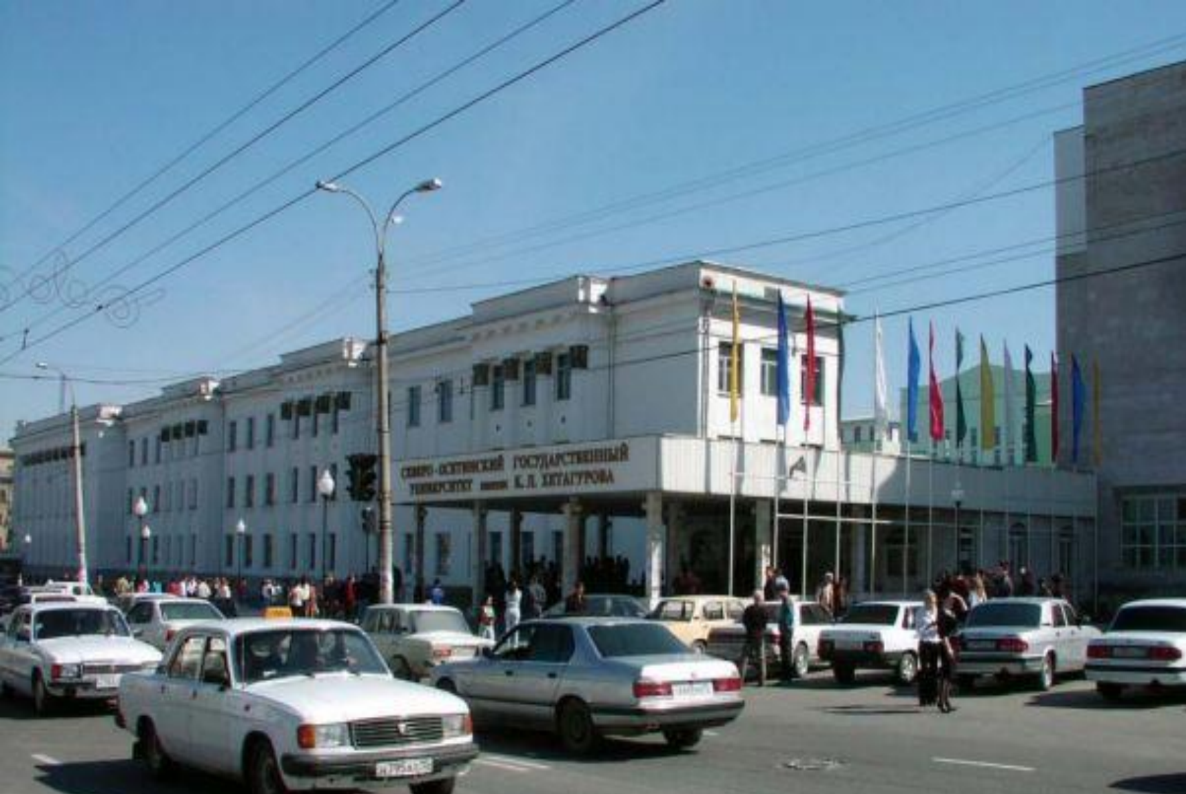
Северо-Осетинский Государственный Университет имени К.Л. Хетагурова