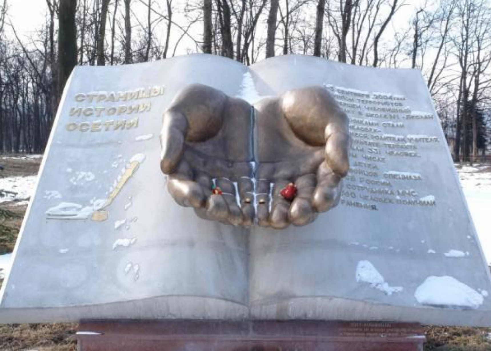
Памятник жертвам бесланской трагедии на Мемориале Славы