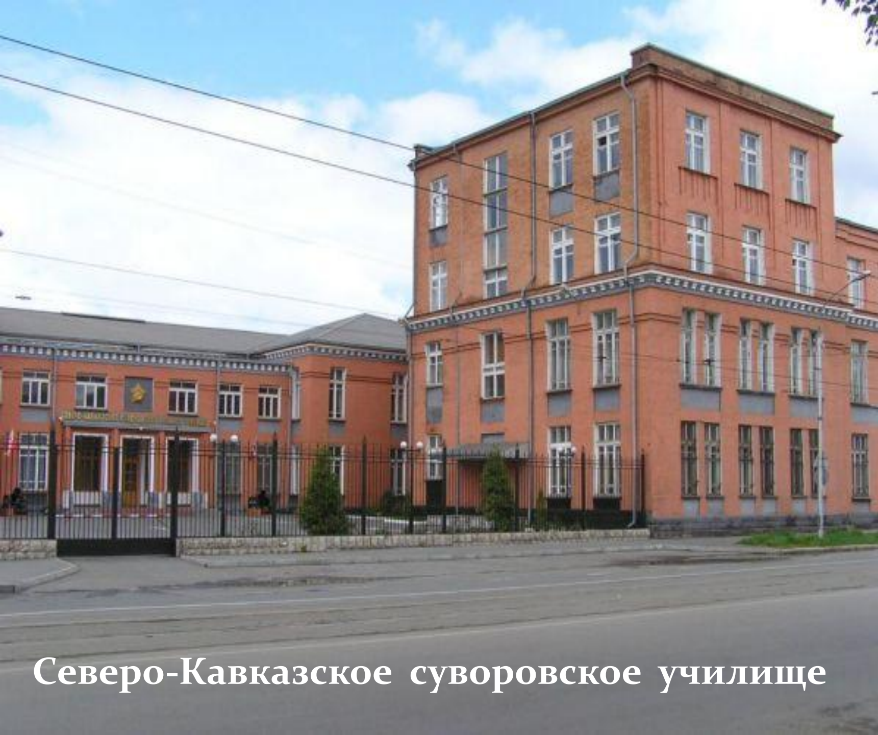
Северо-Кавказское суворовское училище