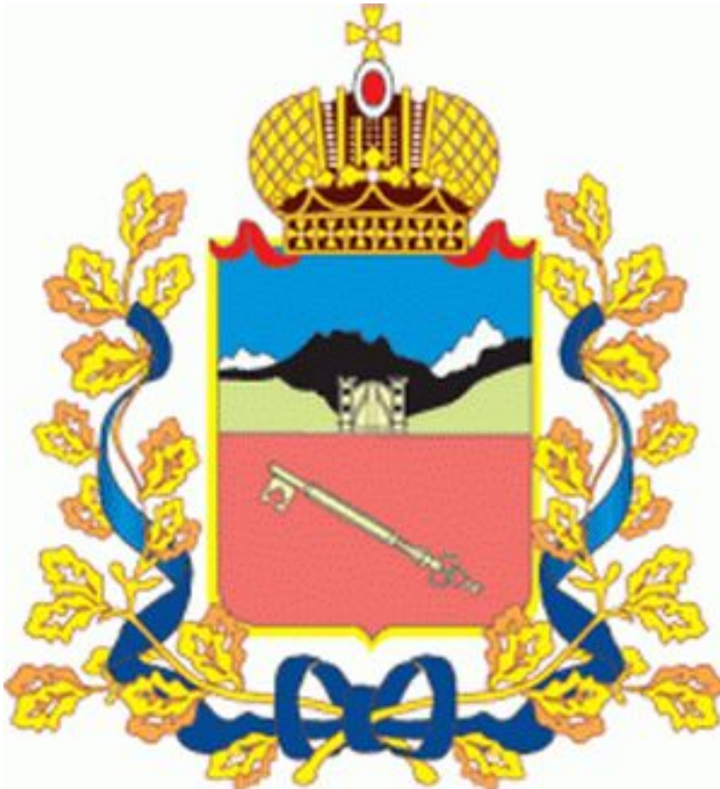
Герб города Владикавказа