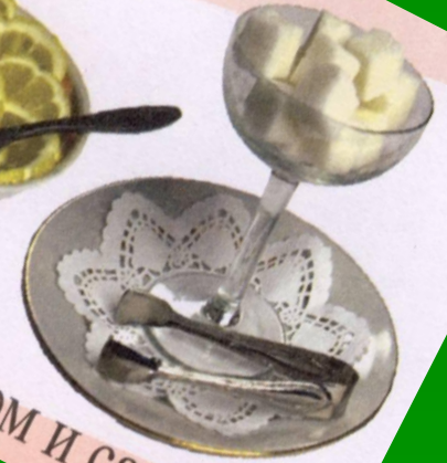
с лимоном и сахаром