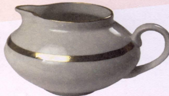
• С МОЛОКОМ