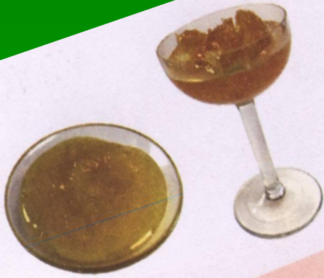
с медом или с вареньем