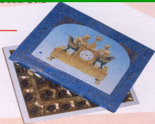
• С КОНФЕТАМИ