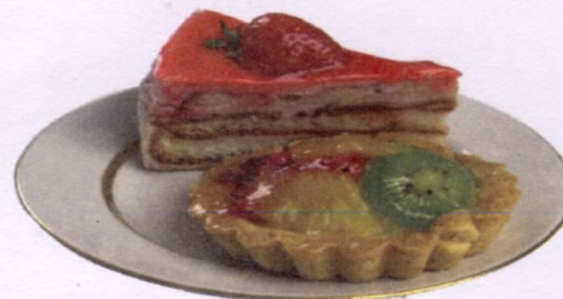
• С ПИРОЖНЫМИ