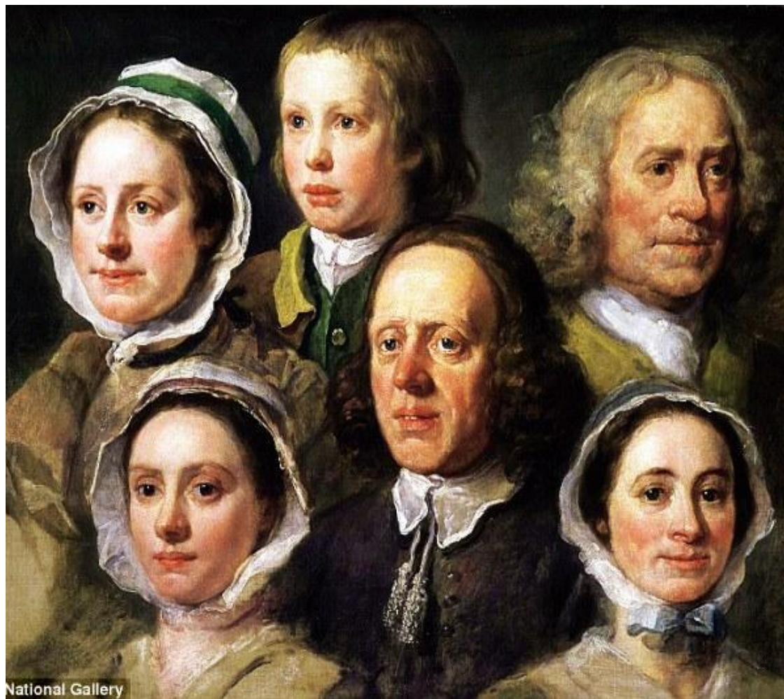
Портрет слуг Хогарта 1950-е годы

С чисто просветительских позиций Хогарт в «Портрете слуг» утверждает ценность человека вне зависимости от классов и сословий и подчеркивает свои глубокие демократические симпатии. Известно, что они были членами одной семьи.