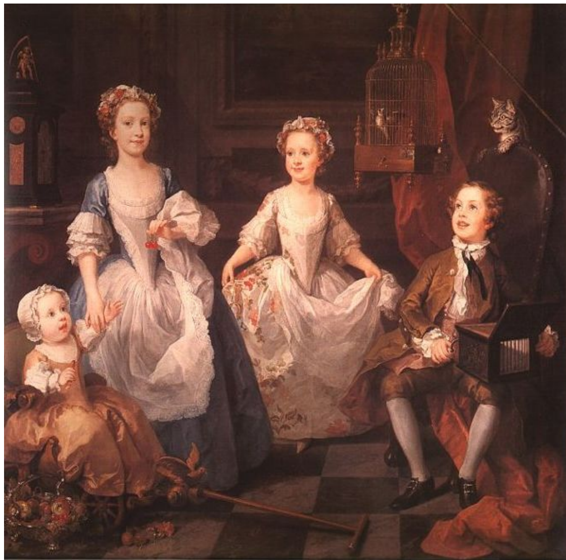
Дети Грэм . 1742

Групповой портрет детей семьи Грэм, глава которой был королевским аптекарем, относится к «сценам собеседования» (жанр английского варианта семейного группового портрета). Такие портреты, а по сути — жанровые сцены, воплощали новый буржуазный идеал счастливой добродетельной жизни. На картине изображены четверо детей, наблюдающих за полетом птицы, выпорхнувшей из клетки. При этом если младшие дети увлечены происходящим и живо реагируют на него, то старшие девочки откровенно позируют художнику. Мальчик играет на механическом органе. Малышка сидит на стульчике, возле которого изображена корзина с фруктами. Кошка забралась на спинку кресла и заморожено следит за птицей, находящейся в запертой клетке. Часы, стоящие на каминной полке, украшены фигурой Купидона с косой, стоящего рядом с песочными часами. Эти символы смерти, скорее всего, не случайны. Известно, что когда художник писал картину, малышки уже не было в живых.