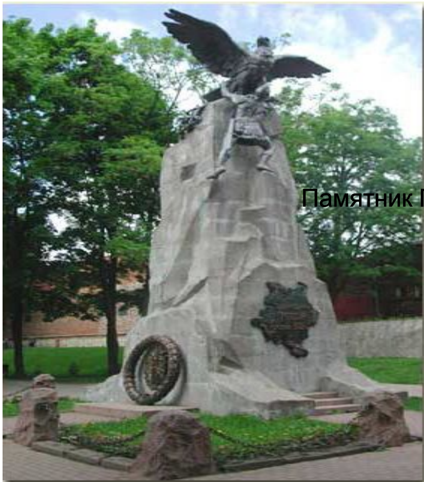
Памятник Героям 1812 г.