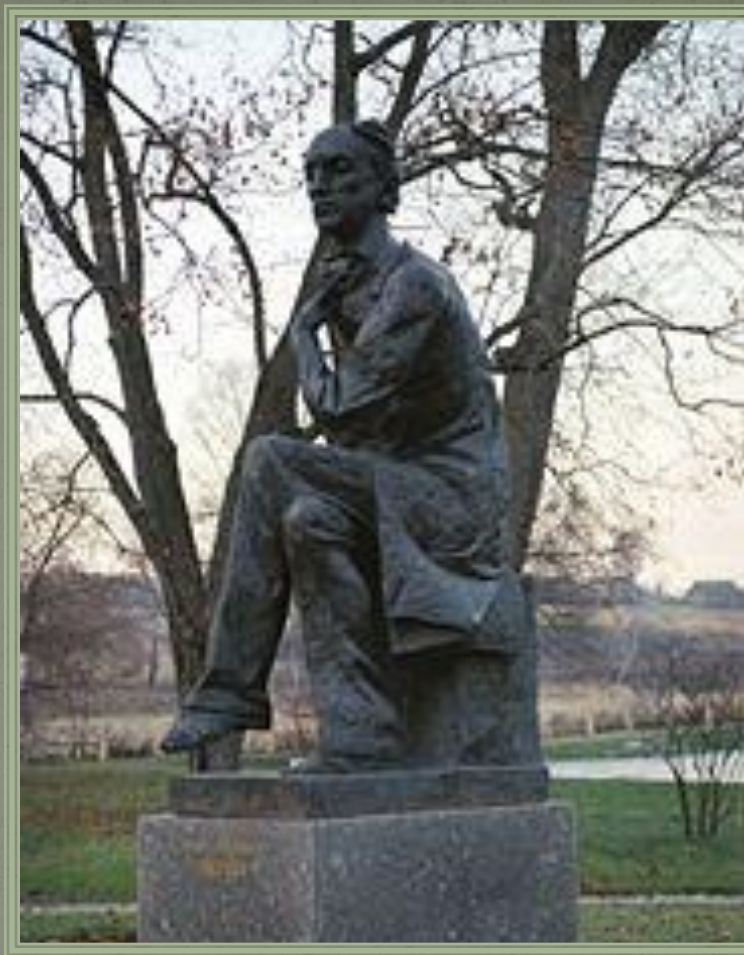
Памятник поэту в Овстуге

Не рассуждай, не хлопочи! Безумство ищет, глупость судит; Дневные раны сном лечи, А завтра быть чему, то будет. Живя, умей все пережить: Печаль, и радость, и тревогу. Чего желать? О чем тужить? День пережит - и слава богу!