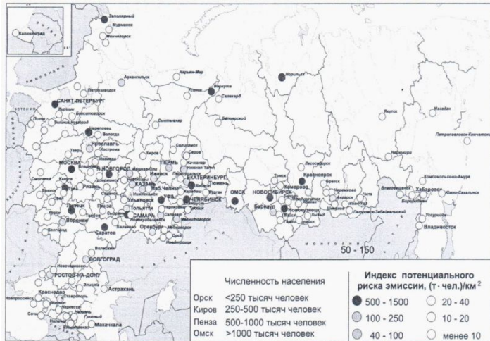
Рис. 9. Индекс потенциального экологического риска для населения городов России