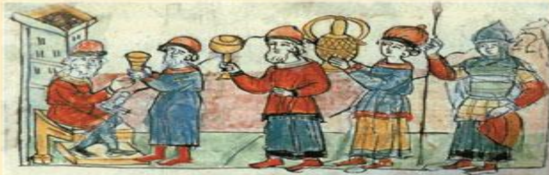
Греки платятъ дань Олегу. Радзивилловская летопись

1. «Мы отъ рода Рускаго, Карлы, Шнегелдъ, Фарлофъ, Веремудъ, Рулакъ, Гуды, Руаддъ, Барихъ, Фреланъ, Рюаръ, Актеву, Труанъ, Лидуль-фостъ, Стемидъ, иже послани отъ Олга великаго князя Рускаго, и отъ всѣхъ, иже суть подъ рукою его, свѣдѣлахъ бояръ, къ вамъ, Львови и Александру и Константину, великимъ о Бозѣ самодержьцемъ, царемъ Грецкимъ, (²) на удержаніе и