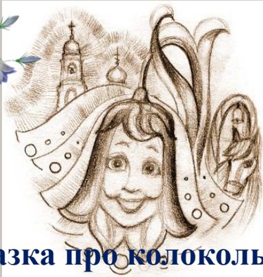
сказка про колокольчик