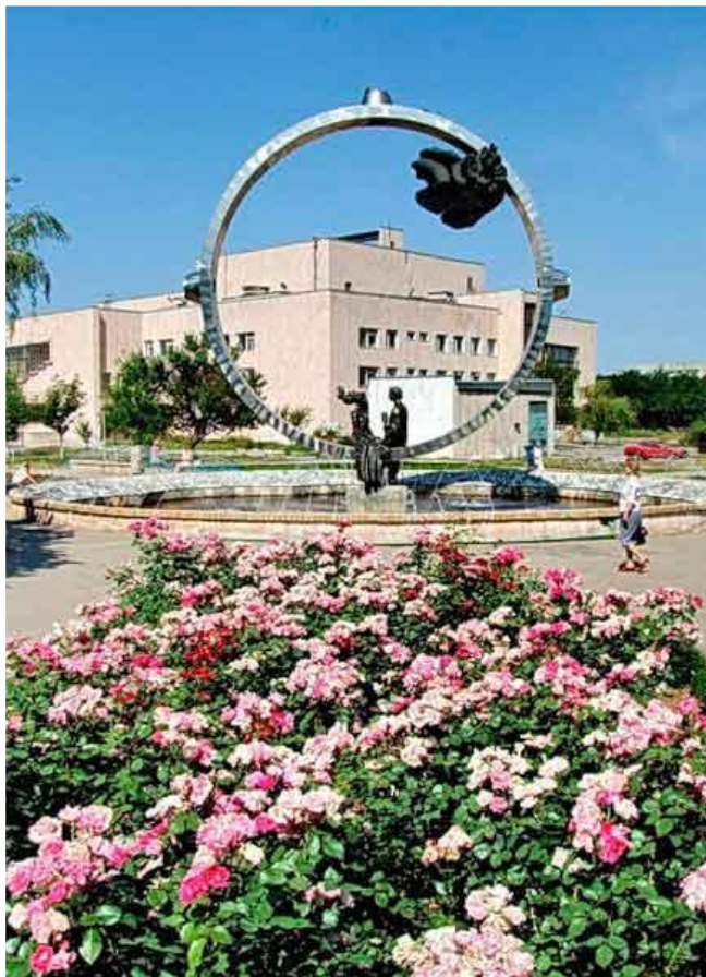
Фонтан - скульптурная композиция "Любовь"