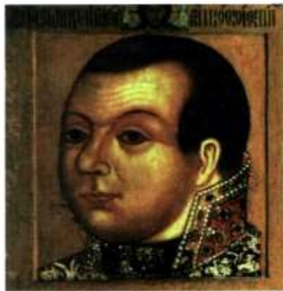
Князь М.В. Скопин-Шуйский. Парсуна. Темпера. Россия. XVII в.