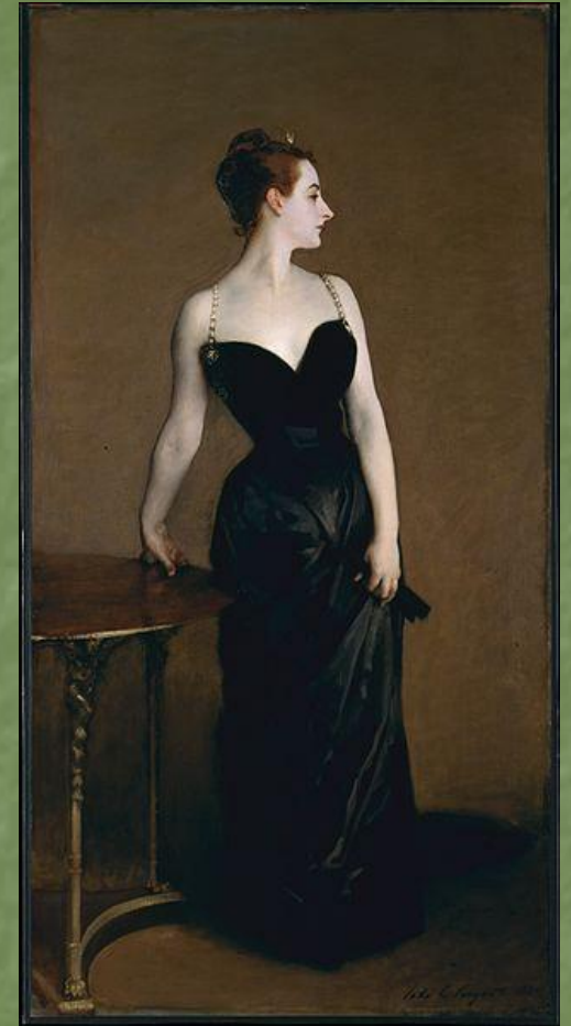
Портрет во весь рост