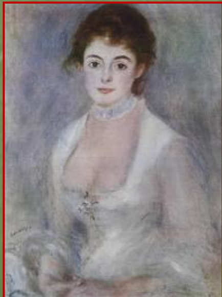
Живописный портрет (масло)