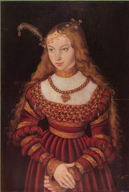
Портрет по бедра