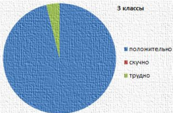
Оценка учащимися занятий внеурочной деятельностью 2014-2015 учебный год