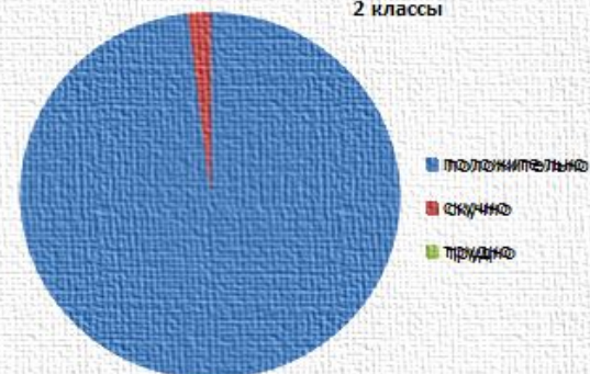
Оценка учащимися занятий внеурочной деятельностью 2014-2015 учебный год