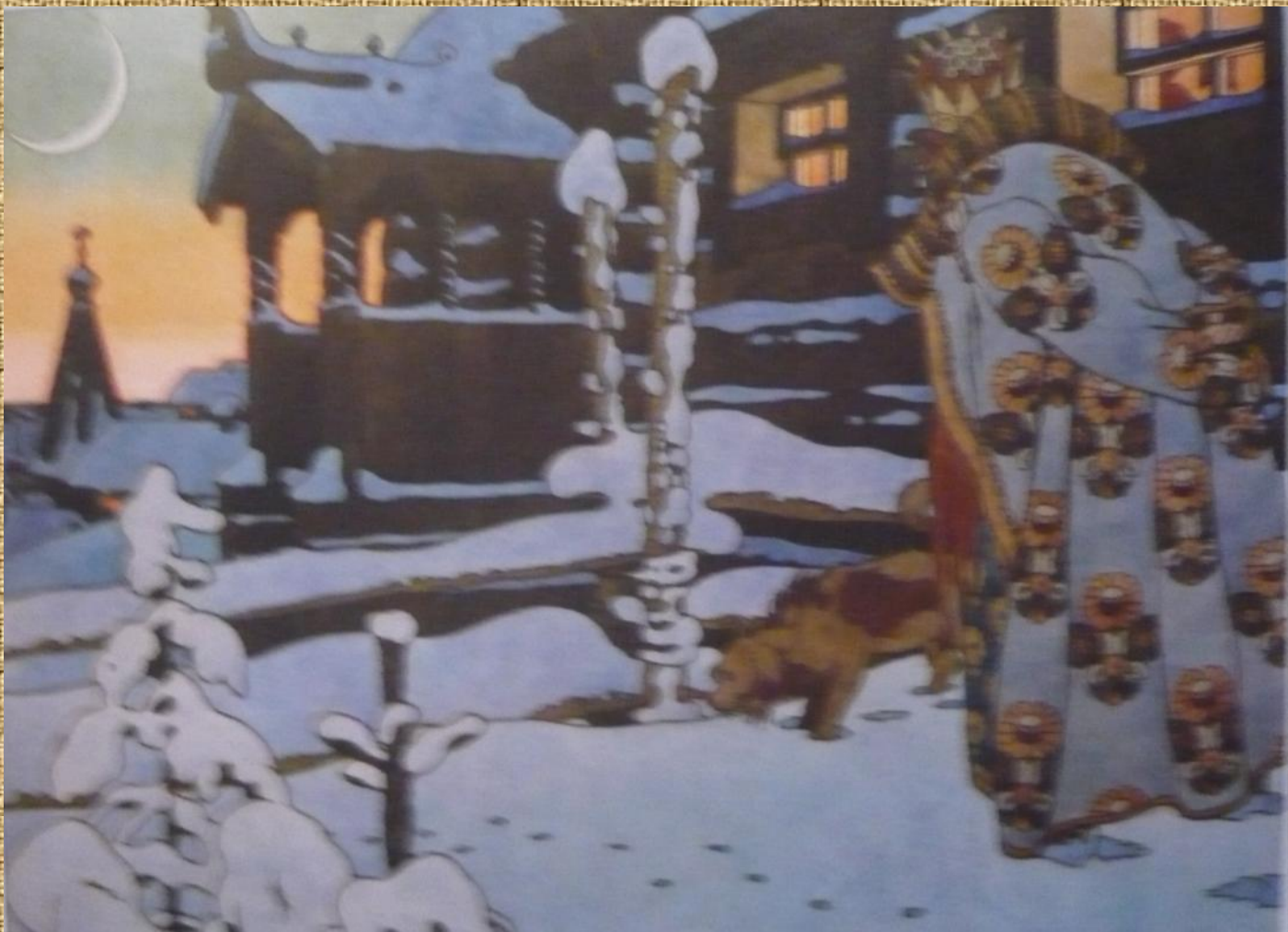
«Сказка о царе Салтане»