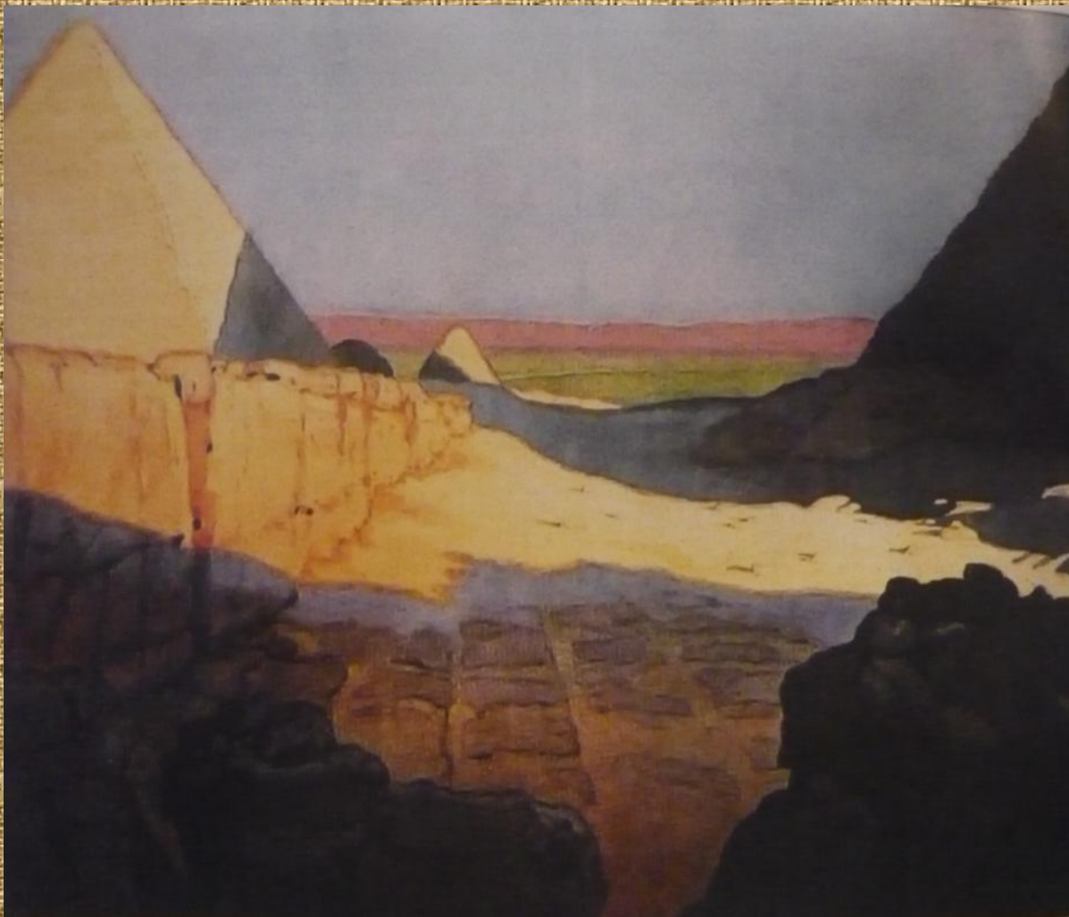
Египет. Пирамиды 1924 г