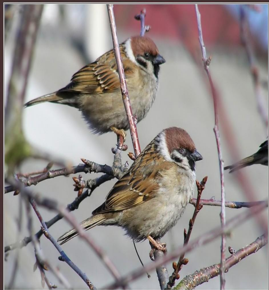
Воробьи полевые ( Passer montanus ) ♂ ♂