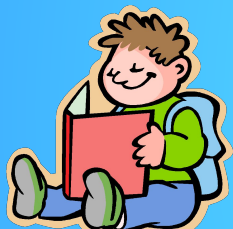
чтение художественной литературы