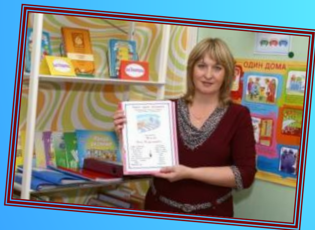
Разработана авторская программа «Ребенок. Дорога. Безопасность.»