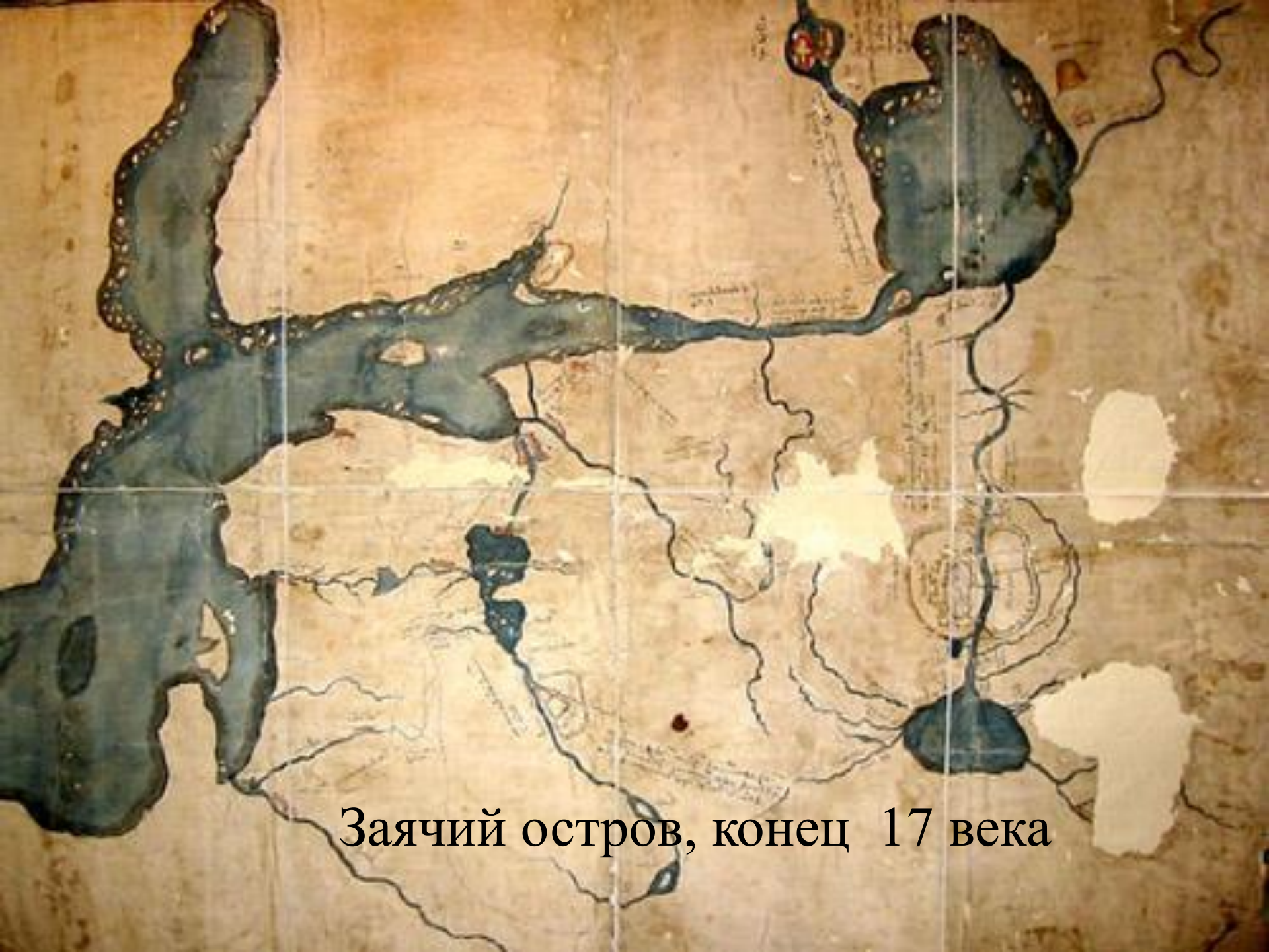
Заячий остров, конец 17 века