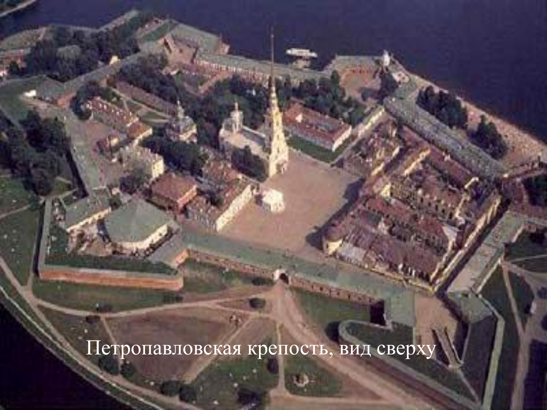
Петропавловская крепость, вид сверху