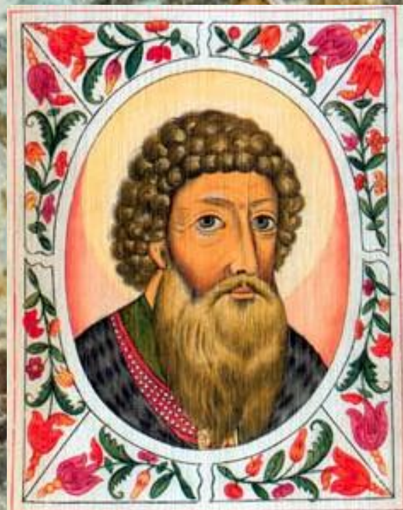
Иван I Данилович Калита