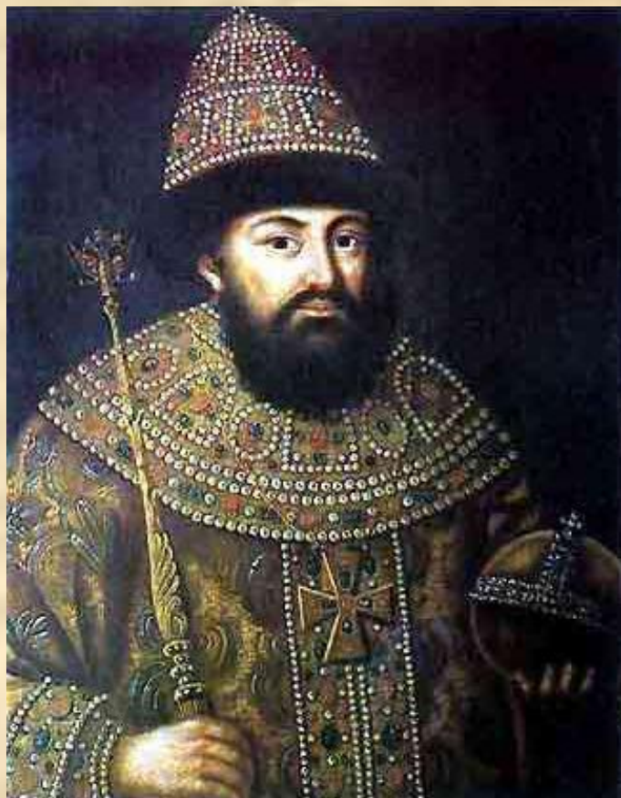
Иван III – великий государь всёя Руси