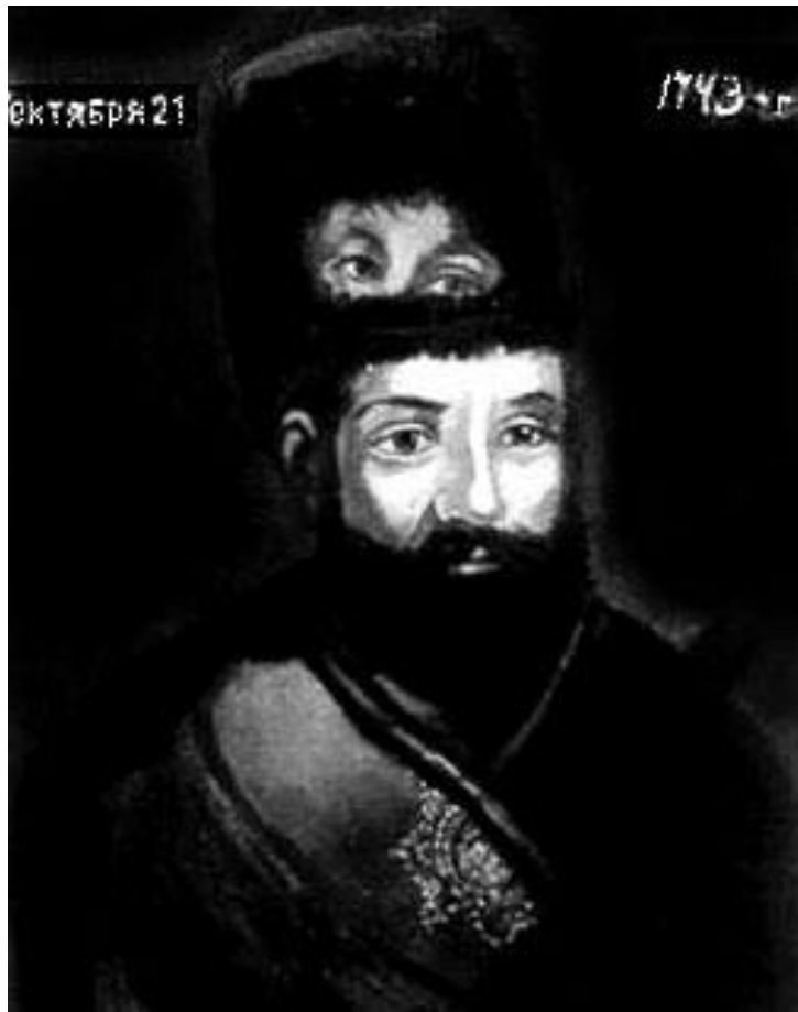
портрет Пугачева, написанный на портрете Екатерины II

Историки именуют события 1773–1774г пугачевщиной . Взгляд на предводителя крестьянского восстания противоречив: одни видели в нём смельчака, бросившего вызов Екатерине II ; другие видели умного, проницательного человека