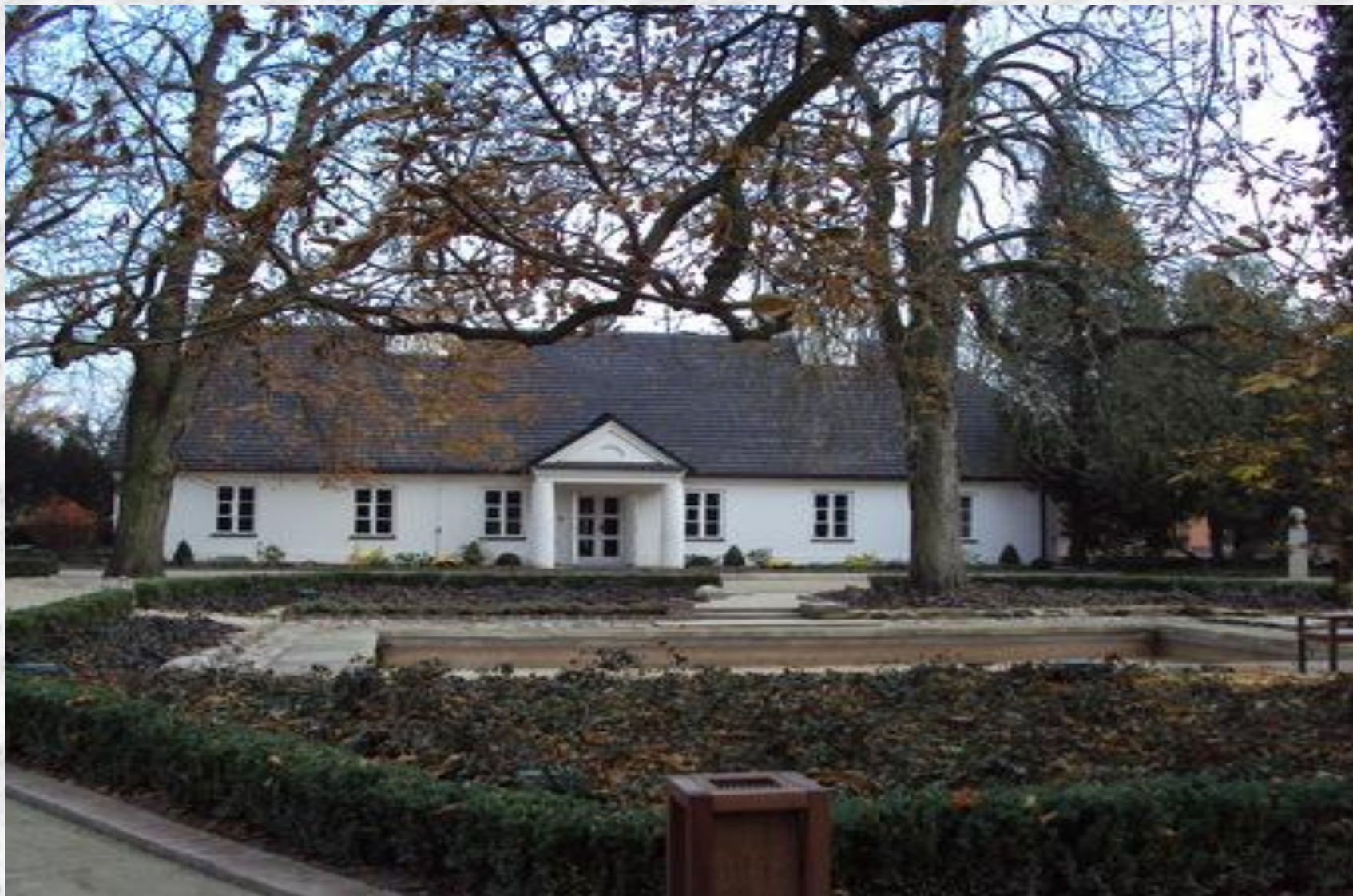
дом, где родился Шопен деревня Желязова Воля под Варшавой