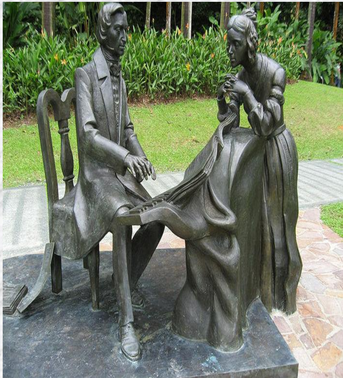
Памятники великому композитору и музыканту.