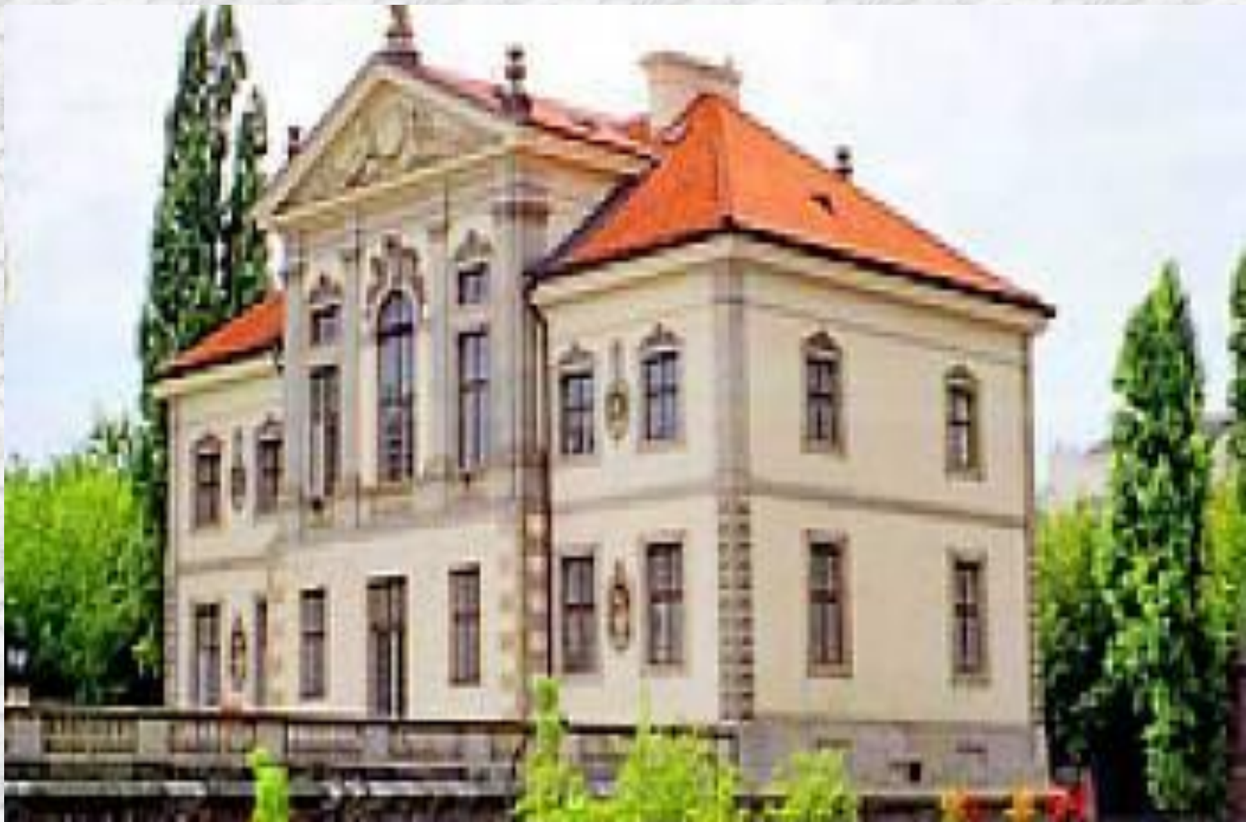
Дом в Париже, где жил Фредерик Шопен.