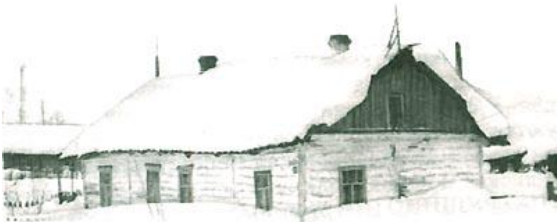
станция Печора в 1942 году