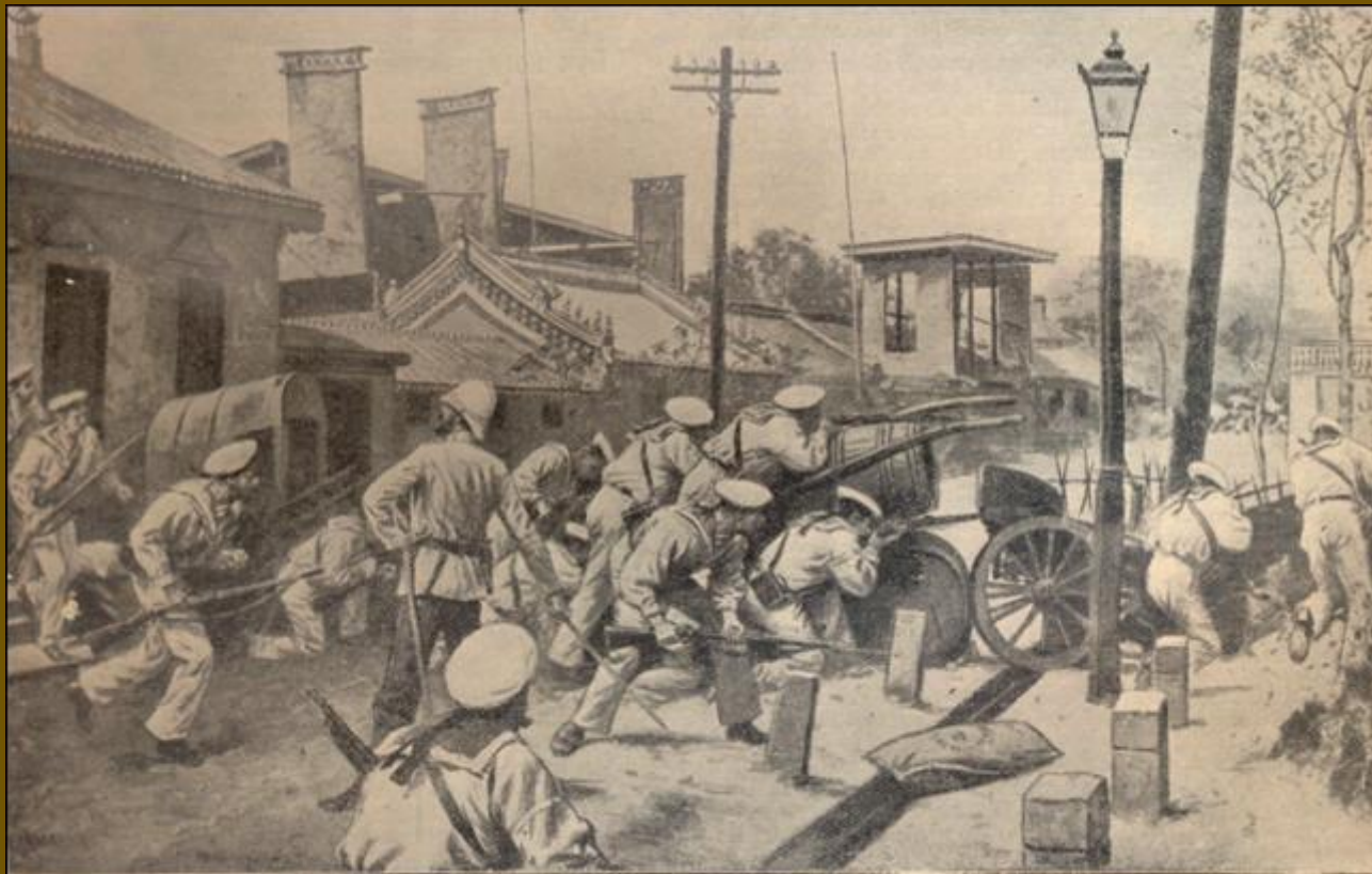
Событія въ Китаѣ. Взятіе Пекина. Русскіе моряки, защищающіе зданіе посольства противъ отряда «Большого Кулана». По рис. С. Бегъ, автотипіи «Нашы».