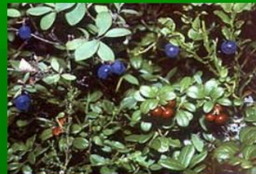
черника и брусника