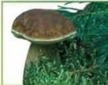
белый гриб (сосновый)