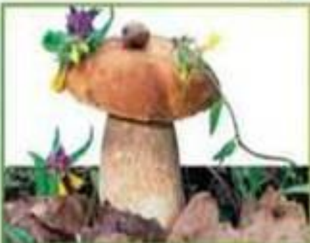
белый гриб (еловый)