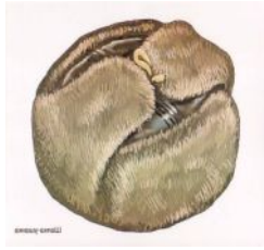
Шапка с мехом