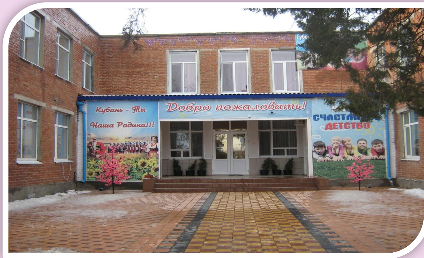
МУНИЦИПАЛЬНОЕ АВТОНОМНОЕ ДОШКОЛЬНОЕ ОБРАЗОВАТЕЛЬНОЕ УЧРЕЖДЕНИЕ «ДЕТСКИЙ САД №8» ДИНСКОЙ РАЙОН, СТ. ДИНСКАЯ, УЛ. КРАСНОАРМЕЙСКАЯ – 72 «А»