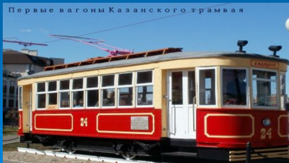
Первые вагоны Казанского трамвая