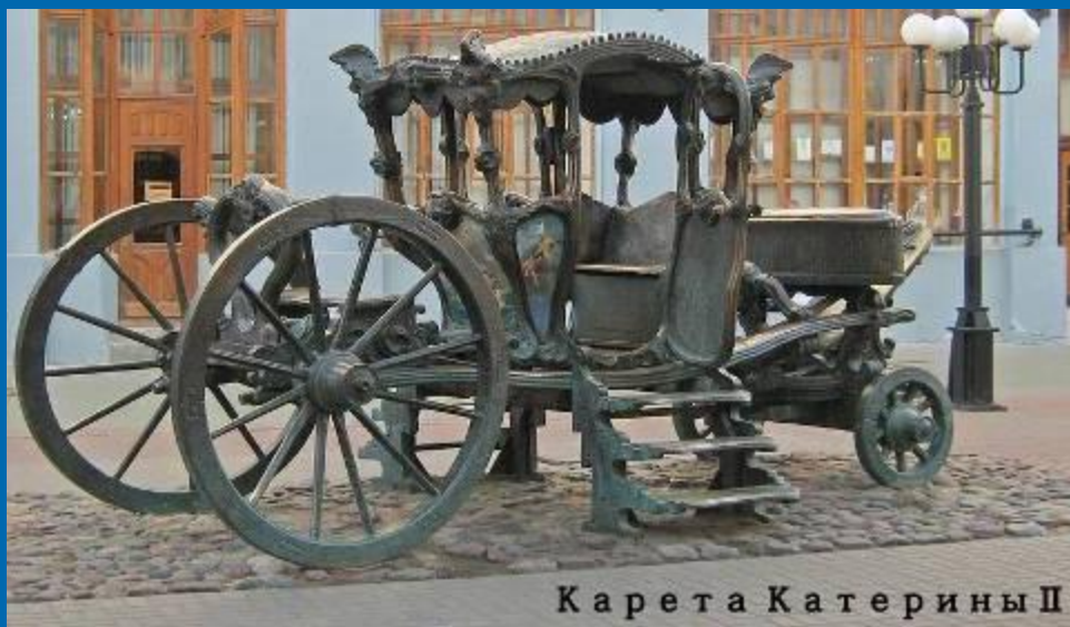
Карета Екатерины II