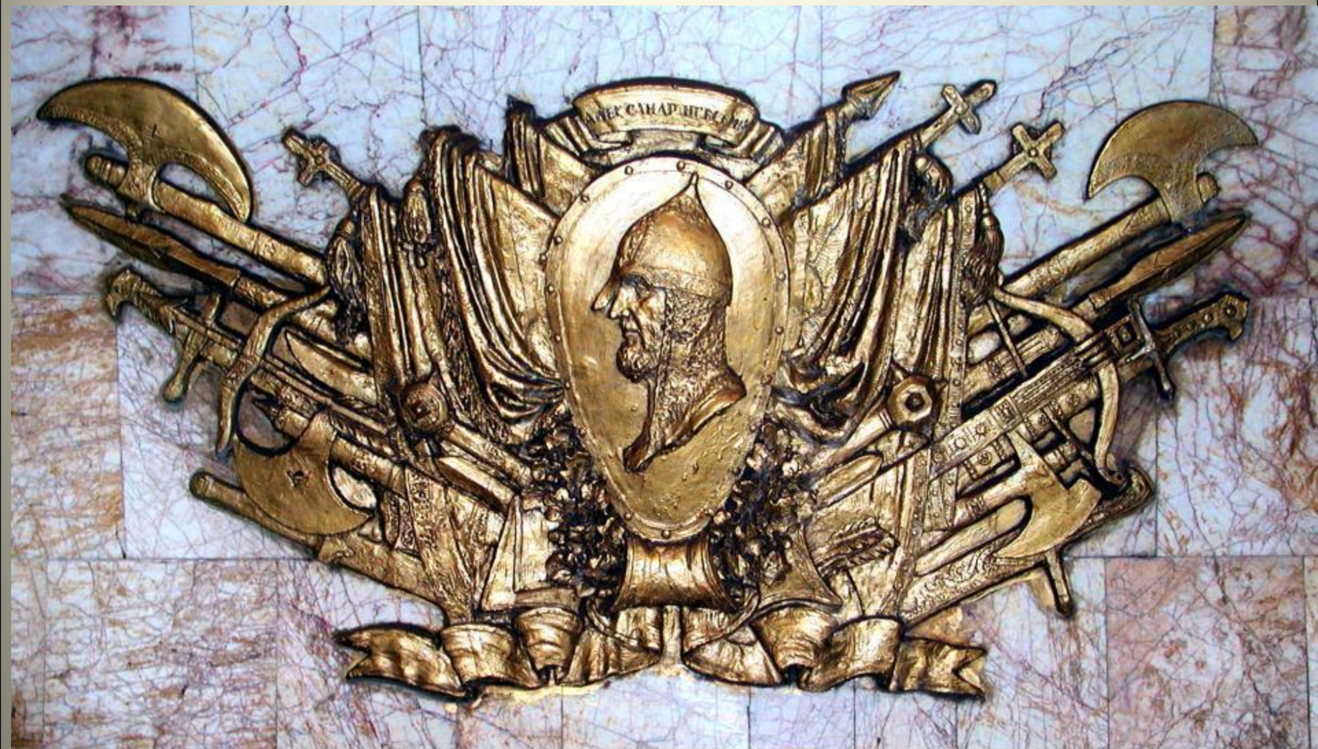
Барельеф, посвященный Александру Невскому. Скульптор Н. В. Томский. 1943 год. Станция Новокузнецкая Московского метрополитена