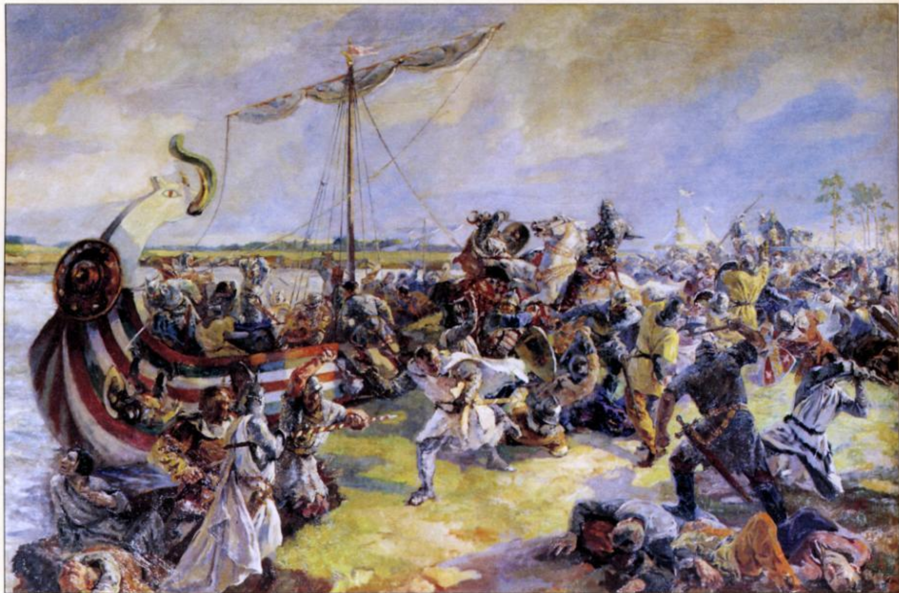
Ю. Трузе-Серова Невская битва 15 июля 1240 года

он у Святой Софии, получил благословение от владыки, наскоро собрал сколько мог рати. Невелика была она, но он бод-