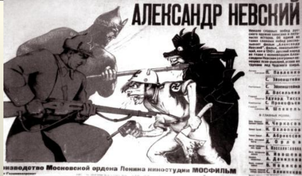
34. Александр Невский. Плакат 1941 г.