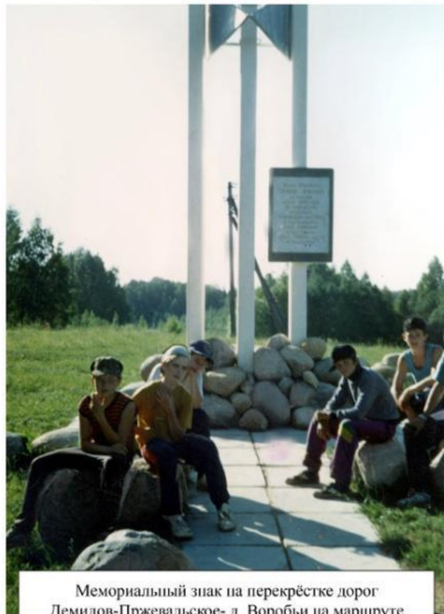
Мемориальный знак на перекрёстке дорог Демидов-Пржевальское- д. Воробьи на маршруте операции "Дети".