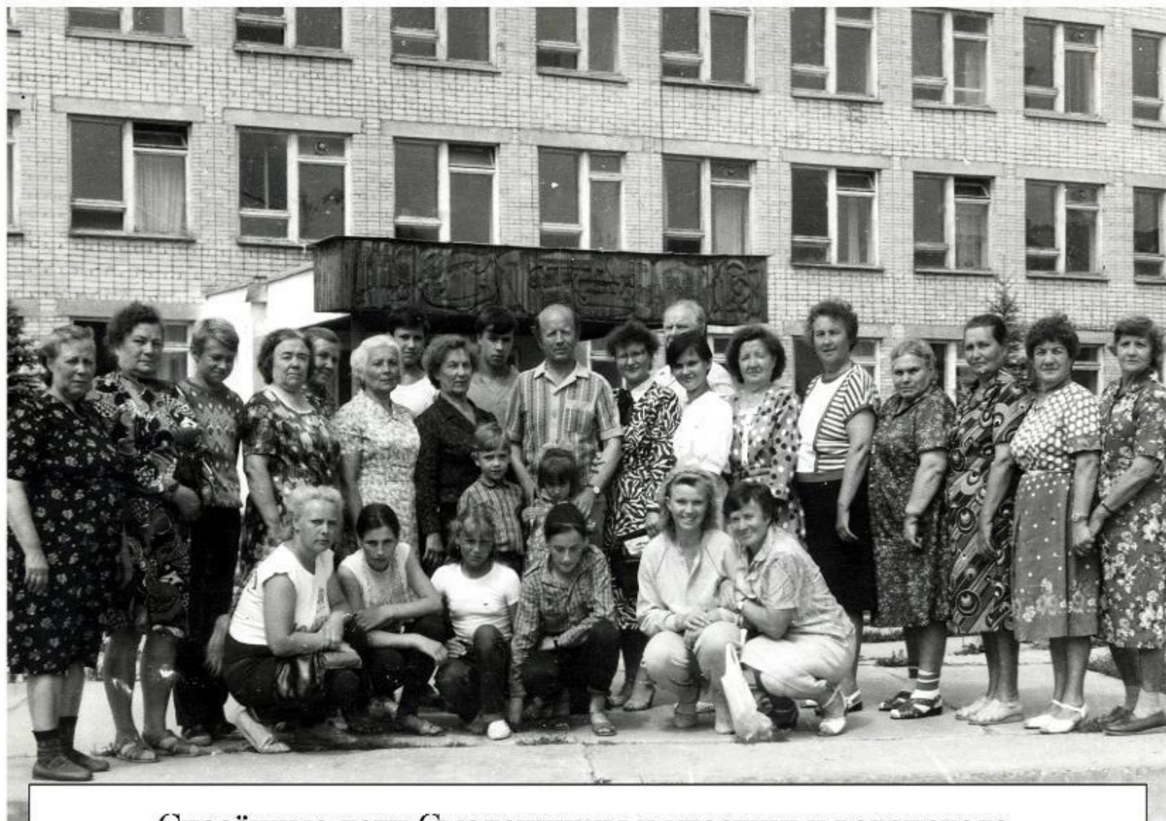
Спасённые дети Смоленщины и участники велопохода. г. Муром, пос. Вербовский 10 июля 1988 г.