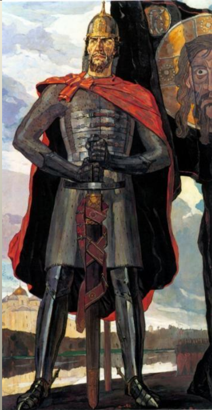
4 И. Копин. Александр Невский. 1942 г.