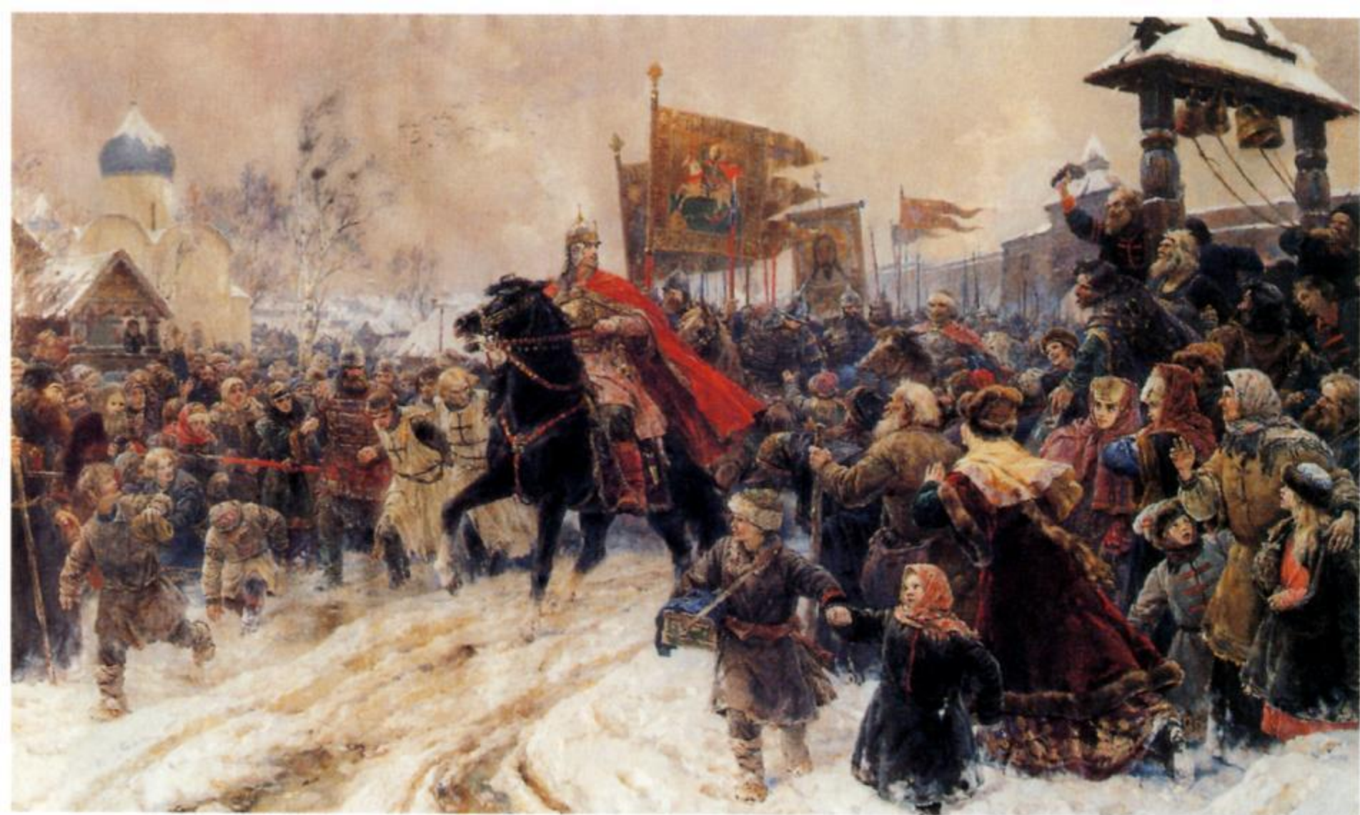
ВЛАДИМИР СЕРОВ Въезд Александра Невского во Псков после Ледового побоища. 1945

Холст, масло. 287 × 492 см Государственный Русский музей