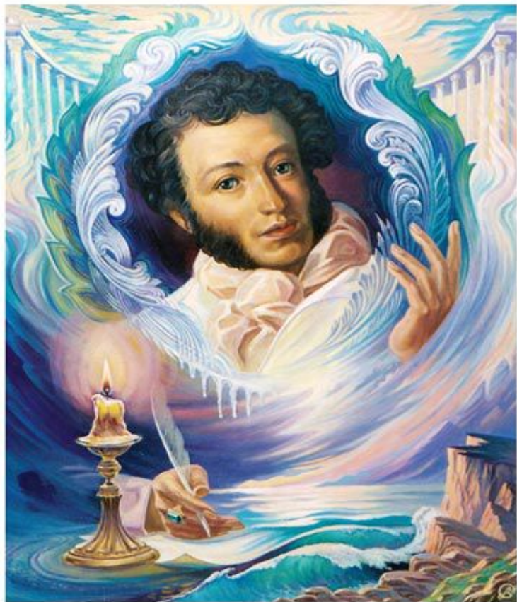
"Российского Престола Пленник" © Художник В. Суворов