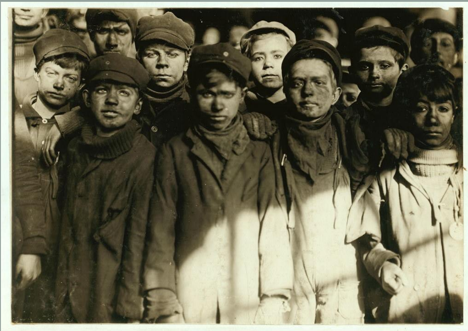
1911 ГОД, HUGHESTOWN BOROUGH, ПИТТСТОН, ШТАТ ПЕНСИЛЬВАНИЯ. ГРУППА МАЛЬЧИКОВ-ДРОБИЛЬЩИКОВ, РАБОТАЮЩИХ НА PENNSYLVANIA COAL CO.