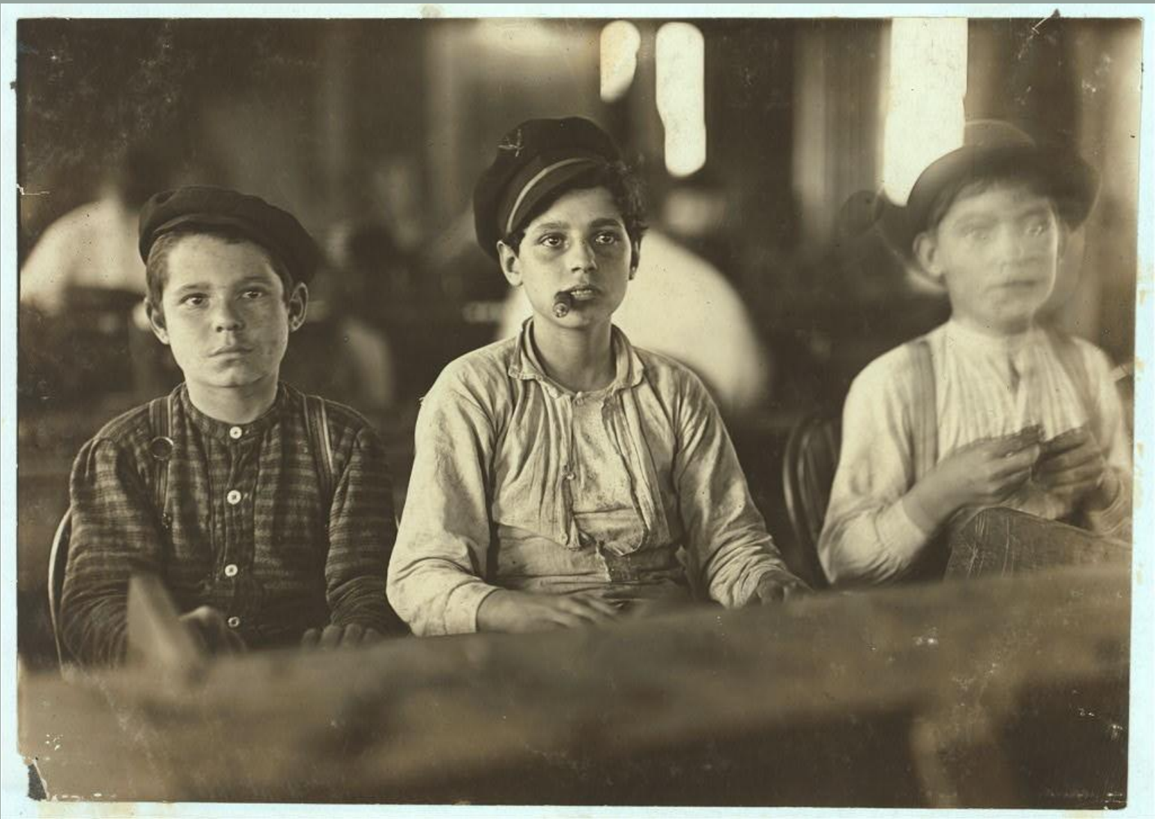
1909. ТАМПА, ФЛОРИДА. МАЛЕНЬКИЕ РАБОЧИЕ НА СИГАРНОЙ ФАБРИКЕ ENGLAHRDT & CO. МАЛЬЧИКИ ВЫГЛЯДЕЛИ МОЛОЖЕ 14 ЛЕТ. РАБОЧИЙ СКАЗАЛ МНЕ, ЧТО В ТРУДНОЕ ВРЕМЯ РАБОТАЮТ МНОГИЕ МАЛЕНЬКИЕ МАЛЬЧИКИ И ДЕВОЧКИ. МОЛОДЫЕ ЛЮДИ КУРЯТ.