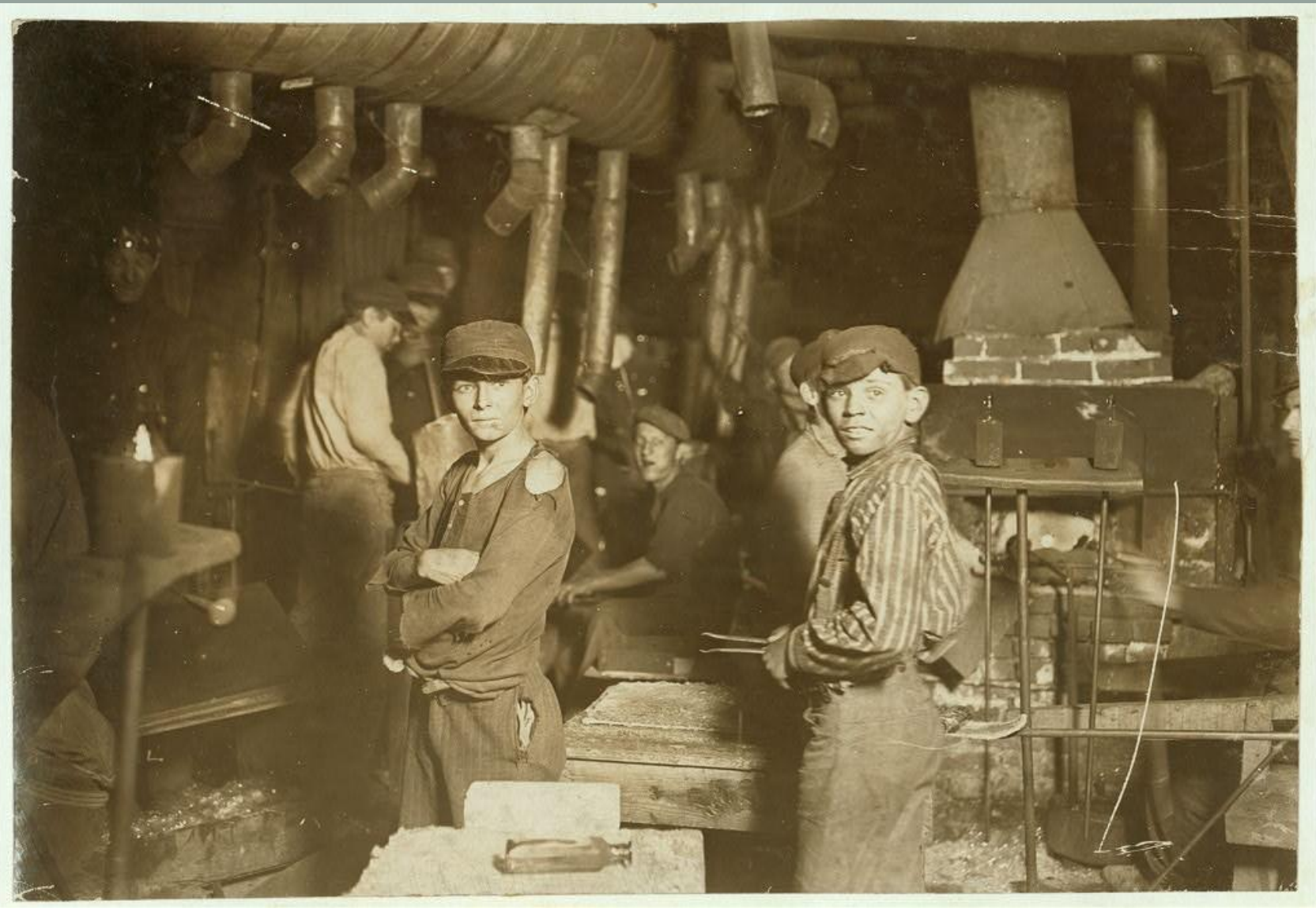
1908 АВГУСТ, ИНДИАНА. НОЧНАЯ СМЕНА НА СТЕКОЛЬНОМ ПРОИЗВОДСТВЕ.