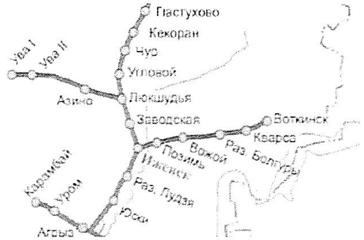
Рисунок 1 – Схема участка ж/д станций Ижевск-Воткинск

В настоящее время между городами Ижевск и Воткинск проложена кабельная линия связи. Действующая кабельная линия связи выполнена по симметричному симметричному медножильному кабелю с использованием технологии HDSL. В качестве коммутационных станций ОТС используется оборудование на базе коммутации каналов СМК-30 производства ООО «Пульсар Телеком». Кабельные линии и комплекс технических средств, эксплуатируемые на данном участке, морально устарели и физически обветшали. Соответственно, качество связи не удовлетворяет не только перспективным, но и существующим в настоящий момент потребностям абонентов - организаций и населения указанных населённых пунктов.