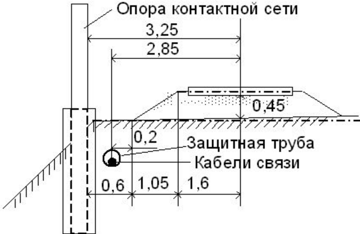
Рисунок 3 – Прокладка кабеля между опорами контактной сети и рельсами

С обеих сторон трубы должны быть длиннее чем на 1 метр окончания насыпи или бровки.