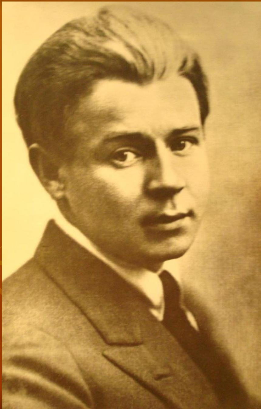
С.Есенин. 1925 г.