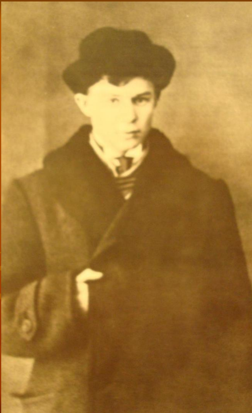
С.Есенин. 1912-13 гг.