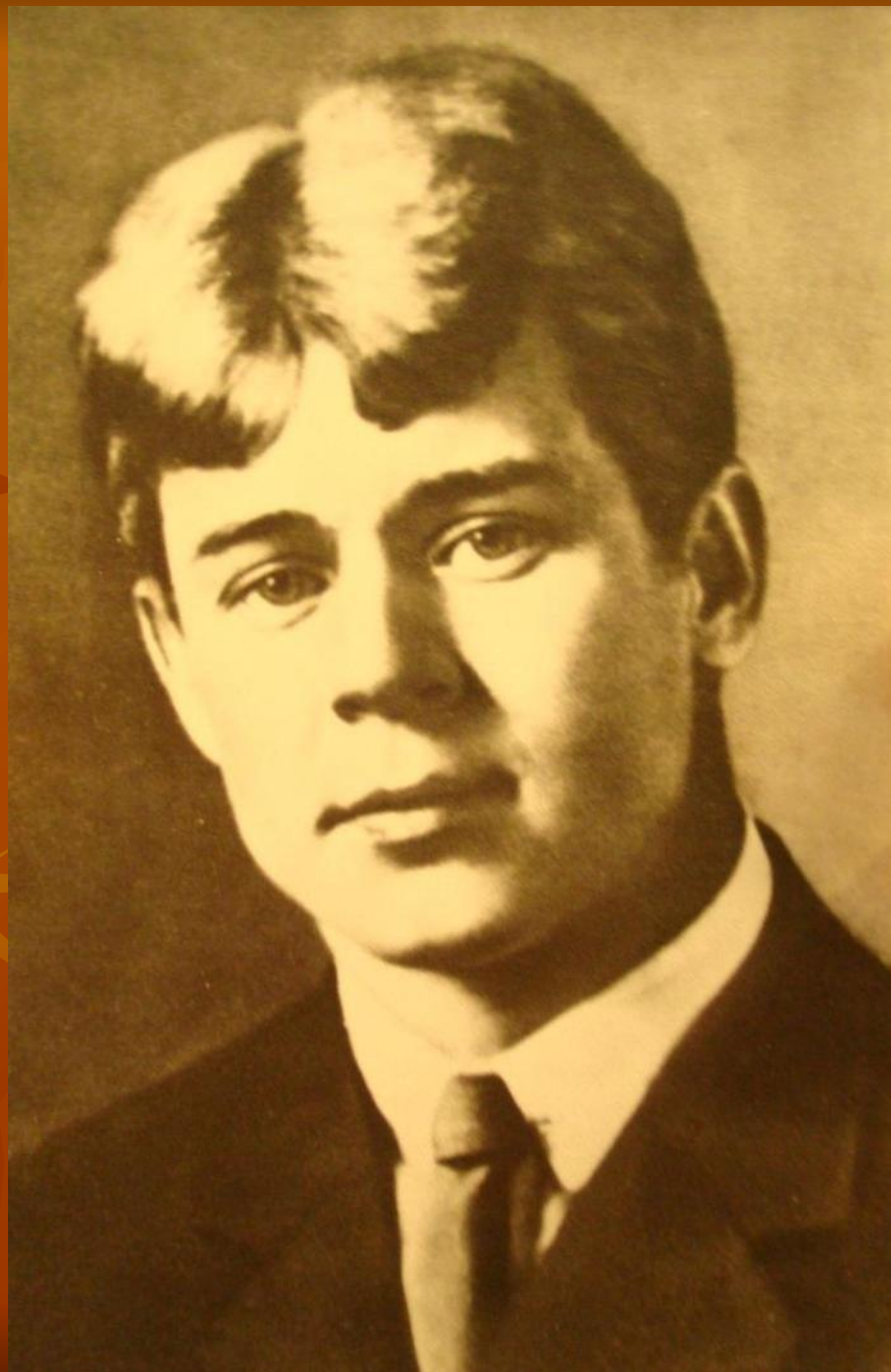
С.Есенин. 1922 г.