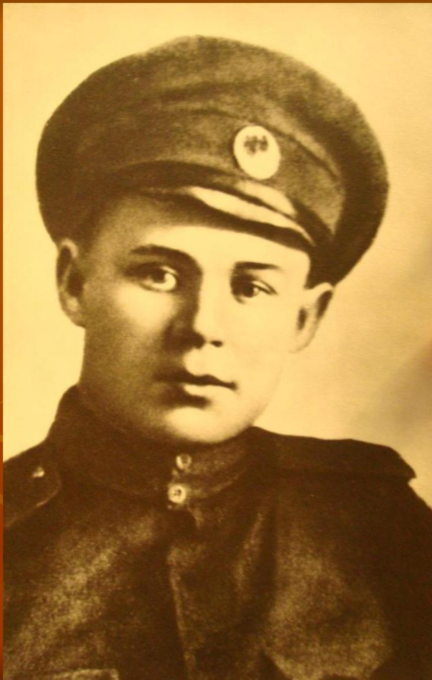
С.Есенин. 1916 г.