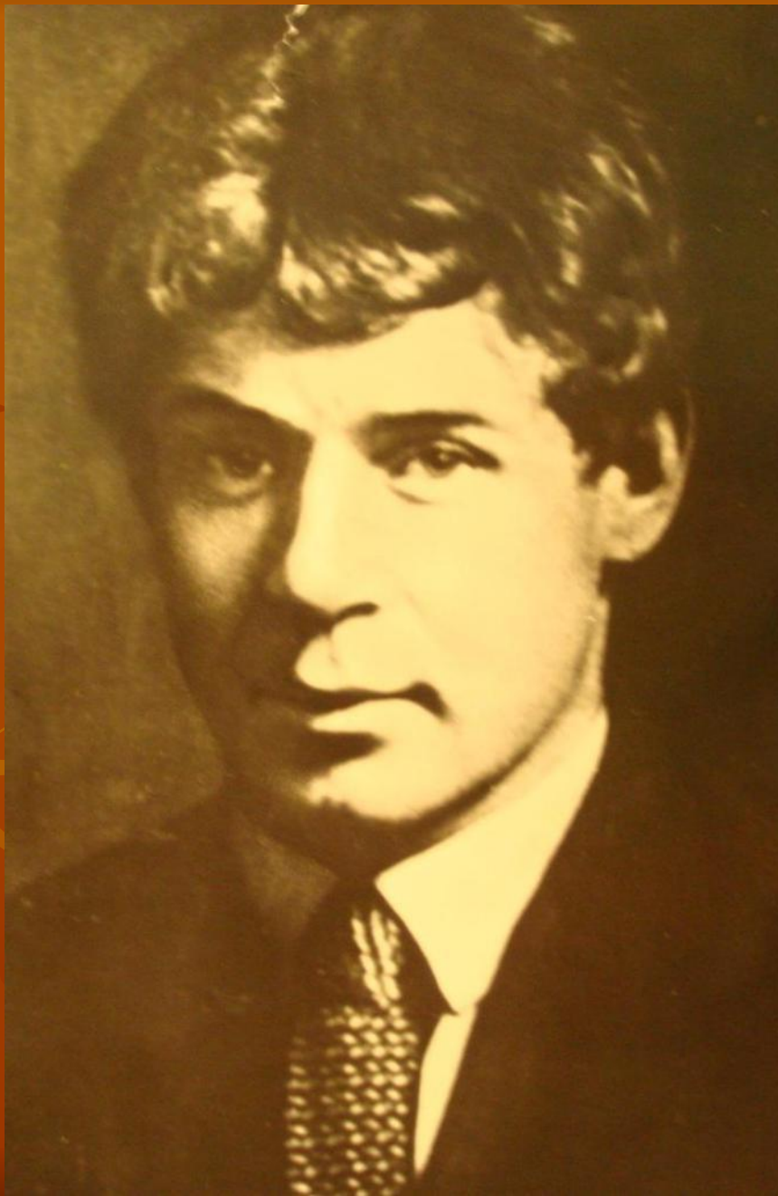
С.Есенин. 1922 г.