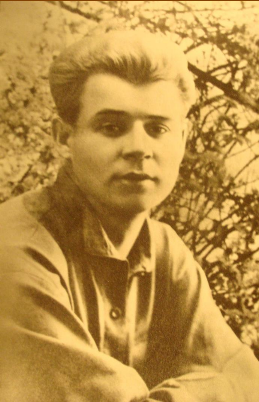
С.А.Есенин 1924 г.