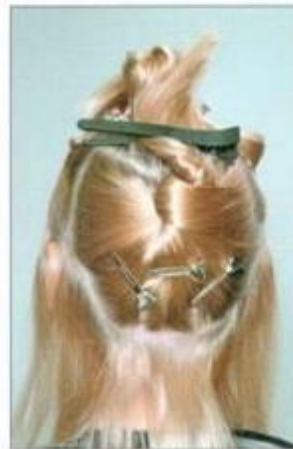
Наращивание волос по Итальянской технологии (на капсулы)

Услуга наращивания волос имеет сегодня большую популярность и распространение.