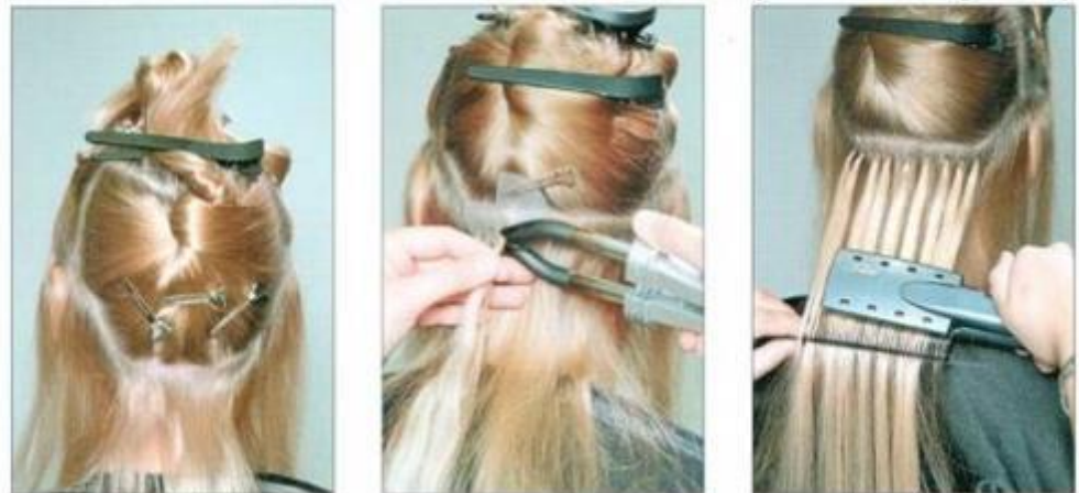
Наращивание волос по Итальянской технологии (на капсулы)

Услуга наращивания волос имеет сегодня большую популярность и распространение.