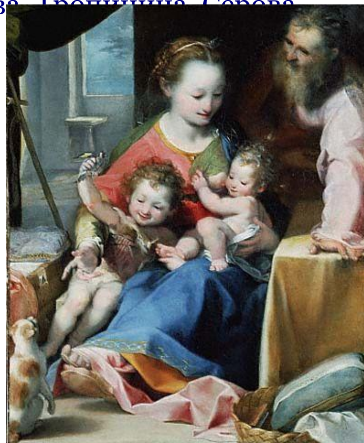
Рембрант «Мадонна с младенцем и Св. Иосифом»