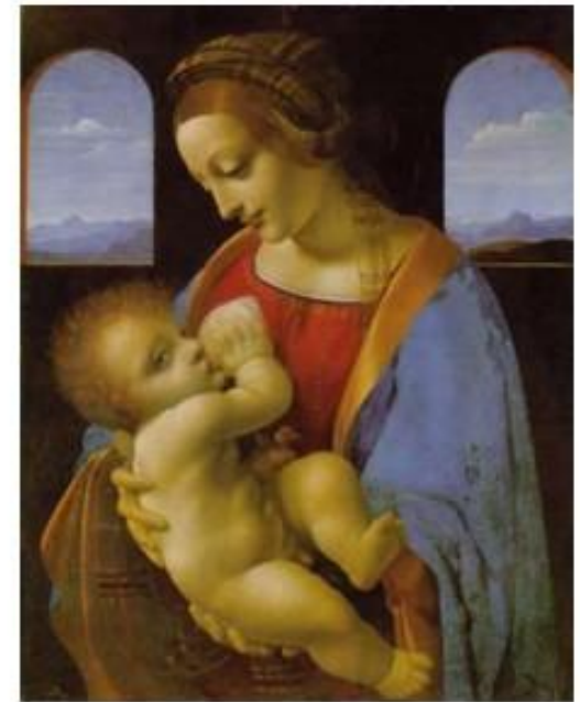
Л. да Винчи. Майонна Лутта

Среди известных портретных шедевров того времени «Лютнист» Микеланджело да Караваджо (1573—1610), в котором художник развивает мотив, взятый из реальной повседневной жизни.