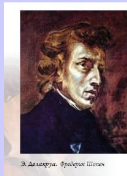
Э. Делакруа. Фредерик Шопен

Едва переступив порог, отделяющий XVII в. от XVIII, увидим на портретах другую породу людей, отличающуюся от предшественников. Придворно-аристократическая культура вывела на первый план стиль рококо с его утонченно-обольстительными, задумчиво-томными, мечтательно-рассеянными образами.