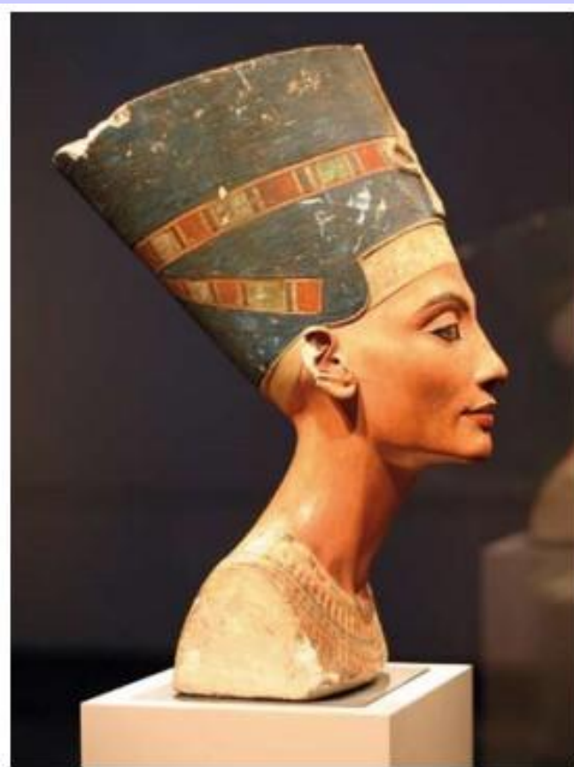
Нефертити. Древний Египет