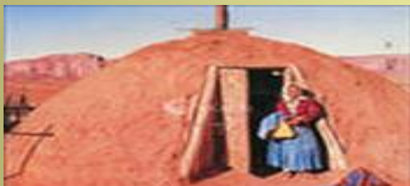
Песчаный индийский дом