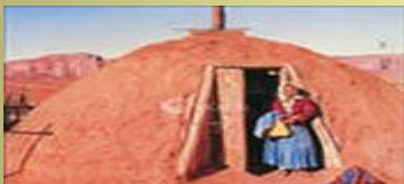
Песчаный индийский дом